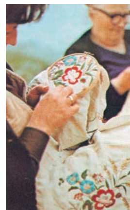
Εικόνα 31.3: Από την κεντητική τέχνη της Θράκης

Σήμερα, όσο ποτέ άλλοτε, υπάρχουν μέρη της περιφέρειας που αντιστέκονται στην αστικοποίηση και προσπαθούν να διατηρήσουν τον παραδοσιακό τρόπο ζωής. Οι κάτοικοι προβάλλουν τις φυσικές