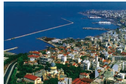
Εικόνα 32.1γ: Πάτρα