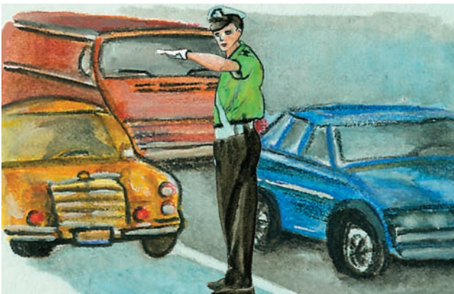
Εικόνα 33.1α: Τροχονόμος