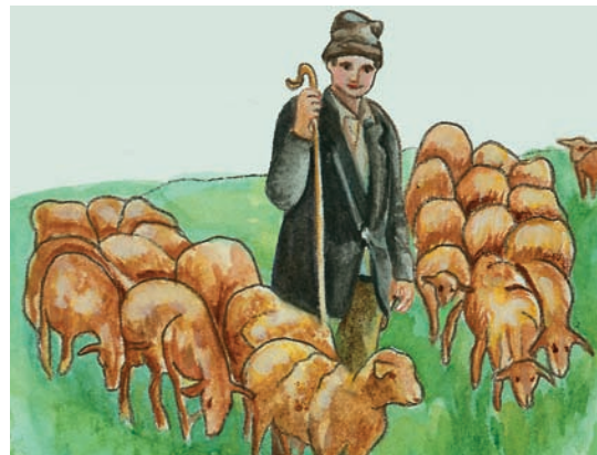
Εικόνα 33.1β: Βοσκός