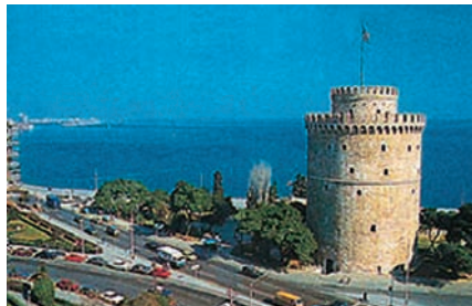
Εικόνα 32.1β: Θεσσαλονίκη