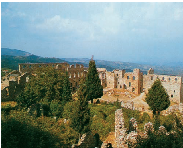
Εικόνα 33.2: Μιστράς

Πολλοί δήμοι και κοινότητες της χώρας μας έπαιξαν σπουδαίο ρόλο στην εξέλιξη της ελληνικής ιστορίας. Ο Μιστράς και η Μονεμβασιά, που βλέπουμε στην παρακάτω εικόνα, είναι δύο από τους δήμους αυτούς.