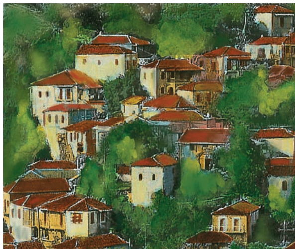
Εικόνα 30.2: Περιοχές με διαφορετική κατανομή πληθυσμού

Οι παράγοντες, οι οποίοι διαμορφώνουν την κατανομή του πληθυσμού στην πατρίδα μας, είναι κυρίως φυσικοί (ορεινά ή πεδινά εδάφη, κλιματικές συνθήκες κ.ά.) και οικονομικοί (εργασία, συγκοινωνίες, περισσότερες ανέσεις κ.ά.). Το μεγαλύτερο μέρος του πληθυσμού συγκεντρώνεται στα πεδινά, όπου μπορούν να πραγματοποιηθούν οι περισσότερες ανθρώπινες δραστηριότητες κι επομένως να αναπτυχθεί η οικονομία. Οι άνθρωποι βρίσκουν εργασία, αυξάνουν το εισόδημά τους και απολαμβάνουν τις υπηρεσίες που παρέχονται από το κράτος. Κατασκευάζονται με μεγαλύτερη ευκολία έργα υποδομής, όπως δρόμοι, γέφυρες, λιμάνια και αεροδρόμια, κτίζονται μεγάλα νοσοκομεία και σχολεία, ιδρύονται βιομηχανικές μονάδες.