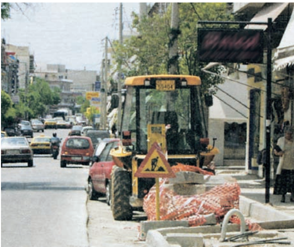
Εικόνα 31.1: Κατασκευή νέων πεζοδρομίων