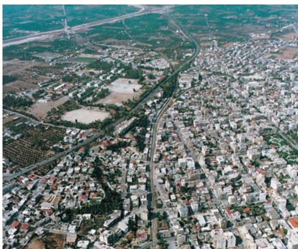
Εικόνα 30.3: Η Κόρινθος από ψηλά

Υποθέστε ότι είστε υπάλληλοι του Υπουργείου Εσωτερικών Δημόσιας Διοίκησης και Αποκέντρωσης (ΥΠ.ΕΣ.Δ.Δ.Α.). Ποια διαφορετικά προβλήματα καλείστε να επιλύσετε σε κάθε μία από αυτές τις περιοχές;