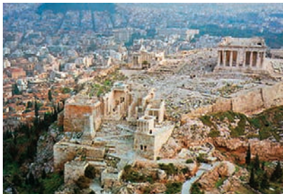
Εικόνα 32.1α: Αθήνα