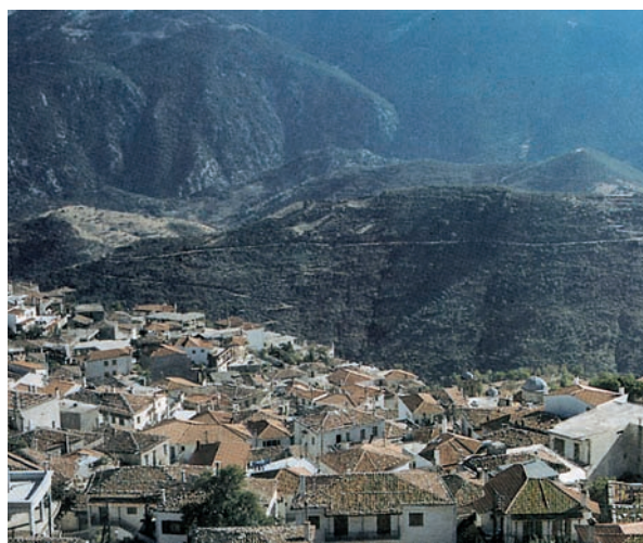
Εικόνα 30.4: Αράχωβα