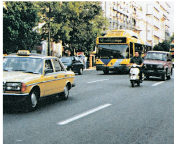
Εικόνα 31.2: Στους δρόμους της πόλης

Τα στιγμιότυπα που παρουσιάζουν οι παραπάνω φωτογραφίες σίγουρα δεν μπορούν να χαρακτηρίσουν ελκυστική τη ζωή στα μεγάλα αστικά κέντρα. Γιατί όμως οι περισσότεροι άνθρωποι συγκεντρώθηκαν σ' αυτά; Ποιες ανθρώπινες ανάγκες καλύπτουν αυτοί οι τόσο πυκνοκατοικημένοι χώροι; Αλήθεια, προσφέρουν σήμερα τα μεγάλα αστικά κέντρα τη ζωή που όλοι θα θέλαμε να ζήσουμε;