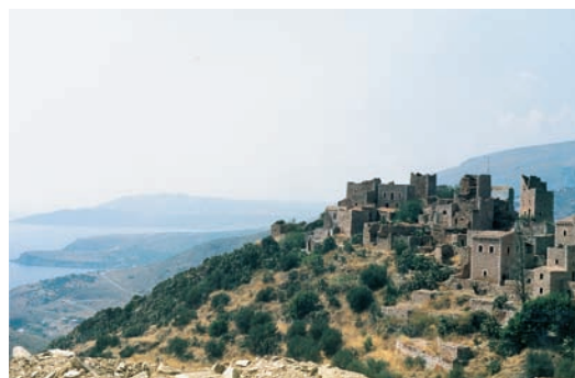
Εικόνα 32.3: Βάθια, Μάνη