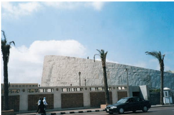
Εικόνα 47.4: Η Βιβλιοθήκη της Αλεξάνδρειας

Η Αλεξάνδρεια και η Έφεσος είναι δύο από τις αρχαίες ελληνικές εστίες. Ας συζητήσουμε μαζί τα ελληνικά στοιχεία, τα οποία εξακολουθούν να υπάρχουν στις πόλεις αυτές με το πέρασμα των αιώνων.