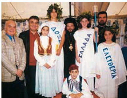
Εικόνα 46.2: Έλληνες στη Νότια Αφρική

Οι σημερινοί Έλληνες της διασποράς, οι ομογενείς μας, αποτελούνται και από Έλληνες δεύτερης και τρίτης γενιάς. Είναι τα παιδιά και τα εγγόνια των Ελλήνων που έφυγαν από την Ελλάδα μετά το Δεύτερο Παγκόσμιο Πόλεμο. Η πολύ κακή οικονομική κατάσταση της χώρας μας και οι πολιτικές διαφωνίες που επικρατούσαν, τους οδήγησαν στην αναζήτηση μιας καλύτερης ζωής στην Αμερική, στην Αυστραλία, στη Γερμανία, στη Ρωσία και σε άλλες χώρες.