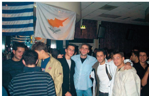
Εικόνα 46.3: Έλληνες στην Αγγλία διαδηλώνουν για το Κυπριακό

Μπορεί οι ομογενείς μας να έχουν ενσωματωθεί στις κοινωνίες των χωρών που εγκαταστάθηκαν, δεν ξεχνούν όμως ποτέ τη μητέρα-πατρίδα. Η Ελλάδα σε κάθε δύσκολη στιγμή έχει συμπαραστάτες τα παιδιά της που ζουν μακριά. Με διαδηλώσεις, με ισχυρές παρεμβάσεις στις κυβερνήσεις των χωρών τους, δυνατότητα την οποία έχουν λόγω της μεγάλης οικονομικής και κοινωνικής θέσης τους, βοηθούν τη χώρα μας να αντιμετωπίσει τα σοβαρά προβλήματα που πολλές φορές παρουσιάζονται. Κύριος οργανισμός που συντονίζει την επικοινωνία με τους Έλληνες της Διασποράς και τις δραστηριότητές τους είναι η Γενική Γραμματεία Απόδημου Ελληνισμού.