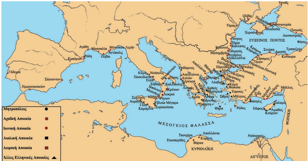
Εικόνα 47.3: Χάρτης κατανομής των αρχαίων ελληνικών εστιών