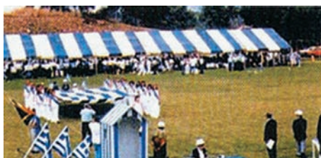
Εικόνα 46.4: 25η Μαρτίου στο Γιοχάνεσμπουργκ

Ας συζητήσουμε μαζί με ποιους τρόπους η Ελλάδα πρέπει να βοηθήσει τους ομογενείς μας, ώστε και οι επόμενες γενιές να διατηρήσουν την ελληνικότητά τους.