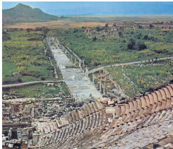
Εικόνα 47.5: Η αρχαία Έφεσος