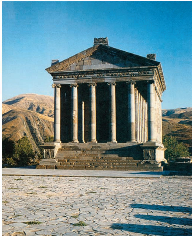
Εικόνα 47.2. Γκαρνί Αρμενίας. Ελληνικός ναός 1ου μ.Χ. αι.

Η εικόνα 47.1 και το κείμενο δείχνουν τη διατήρηση του ελληνισμού στις εστίες, που δημιούργησαν οι πρόγονοί μας, όταν αναζητούσαν μια νέα ζωή μακριά από την πατρίδα. Ας συζητήσουμε μαζί τα ελληνικά χαρακτηριστικά στοιχεία της καθημερινής ζωής των κατοίκων αυτών των περιοχών, τα οποία διατηρούνται για πολλούς αιώνες, παρόλο που οι άνθρωποι αυτοί μπορεί και να μη γνωρίζουν αρκετά στοιχεία για την Ελλάδα.