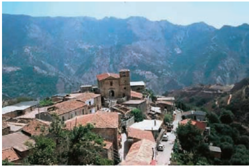
Εικόνα 47.1: Γκαλιτσιανό, Ιταλία