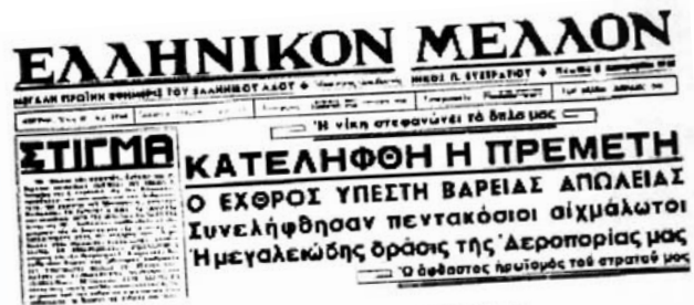
3 Δεκ 1940: Πρεμετή