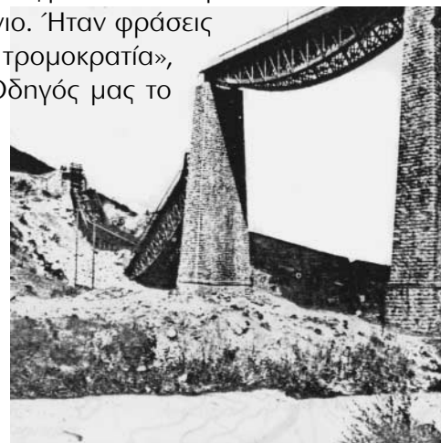
Γοργοπόταμος (Εκδ. Αρχηγείου Ενόπλων Δυνάμεων, 1970)

Ήσεν πια τις προκηρύξεις. Χαρτάκια ήταν, με λόγια θαρραλέα που μας χάριζαν ελπίδες. Οι γενναίοι μας τα τύπωναν κρυφά και τα μοίραζαν, για να μαθαίνει ο κόσμος την αλήθεια και να μην πιστεύει τα ψέματα των κατακτητών.