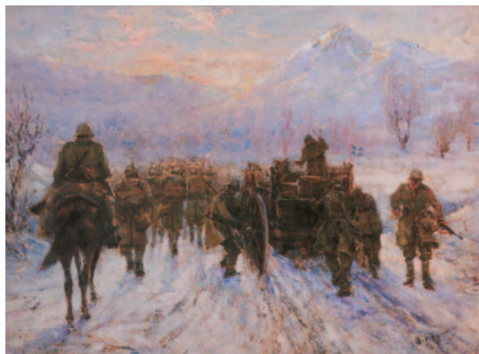
Ουμβέρτος Αργυρός «Εμπρός για τα σύνορα» συλλογή Πολεμικού Μουσείου

Σ. Τζιρόπουλος, Ημερολόγιον από τον πόλεμον του 1940, Νέα Θέσις, Αθήνα, 1997(απόσπασμα)