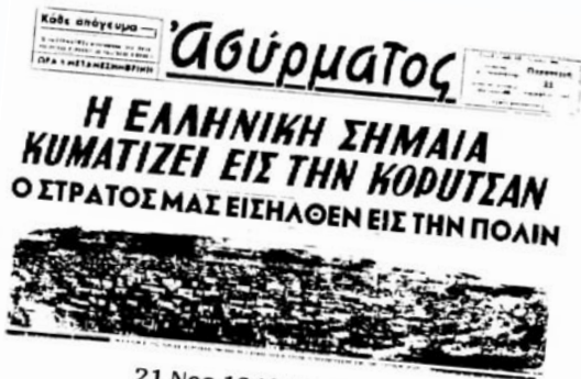
21 Νοε 1940: Κορυτσά