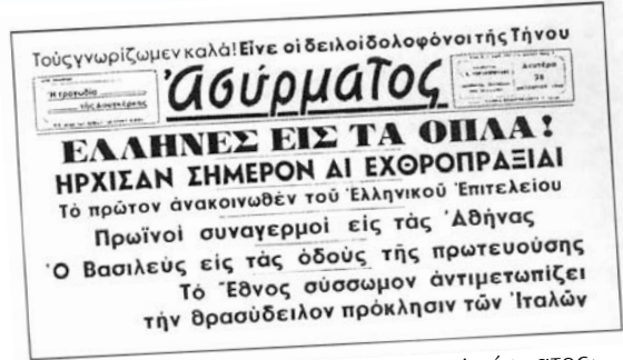
Η πρώτη σελίδα της εφημερίδας «Ασύρματος» της 28 ης Οκτωβρίου 1940.