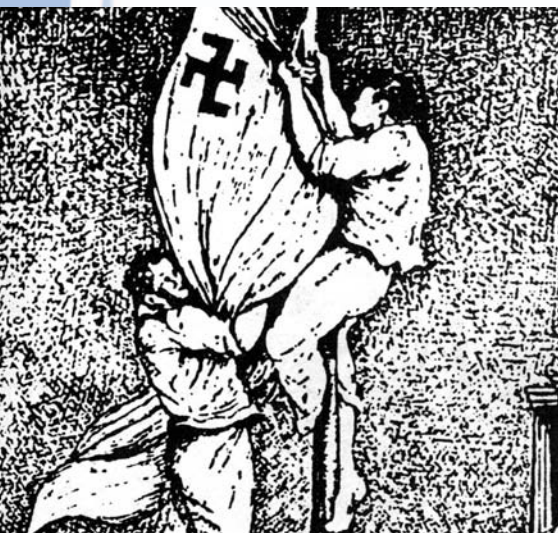
Ο Λάκης Σάντας και ο Μανόλης Γλέζος, 17χρονα παλικάρια τότε, αποφάσισαν στις 30 Μαΐου 1941 να κατεβάσουν από την Ακρόπολη τη γερμανική σημαία.

Σπύρος Τσίρος, Οι πηλίνες Μούσες , εκδ. Κέδρος, Αθήνα, 1988 (διασκευή)