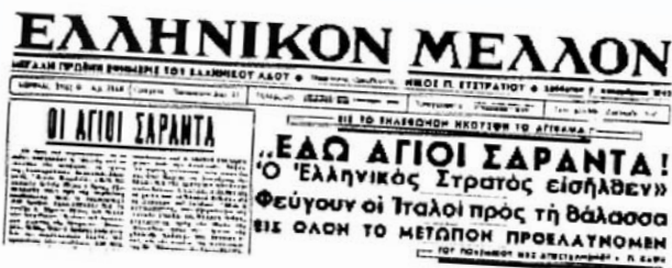
6 Δεκ 1940: Άγιοι Σαράντα