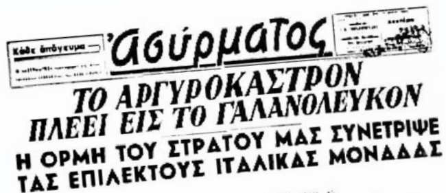
8 Δεκ 1940: Αργυρόκαστρον