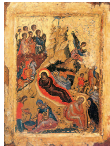
Εικόνα της Γέννησης του Χριστού (Ι. Μ. Μεγάλου Μετεώρου).

«Για δείτε αυτή την εικόνα», παρατήρησε ο κύριος Γιάννης. «Δείχνει τη Γέννηση του Χριστού και βρίσκεται στο Μεγάλο Μετέωρο, ένα από τα μοναστήρια των Μετεώρων. Ο αγιογράφος εδώ δεν ενδιαφέρεται να “φωτογραφήσει” τη Γέννηση, αλλά να δείξει το συμβολισμό της. Έτσι, βλέπετε ότι οι μορφές είναι άλλοτε μικρότερες, όπως οι Μάγοι και άλλοτε μεγαλύτερες, όπως η Παναγία. Επίσης, η σπηλιά όπου γεννήθηκε ο Χριστός παρουσιάζεται σαν βράχος που μοιάζει να κατευθύνεται στον ουρανό. Στο κέντρο του βρίσκεται λίγο ανασηκωμένη η Παναγία, ενώ πίσω της ένα ζώο ζεσταίνει με την αναπνοή του το Θείο βρέφος, φανερώνοντας ότι όλη η πλάση προσκυνά τον Βασιλιά των ουρανών. Κάτω δεξιά κάθεται σκεπτικός ο Ιωσήφ, μη μπορώντας να εξηγήσει το θαυμαστό γεγονός, ενώ δίπλα του ένας βοσκός, συζητά μαζί του. Κάτω αριστερά περιγράφεται η σκηνή του λουτρού του νεογέννητου