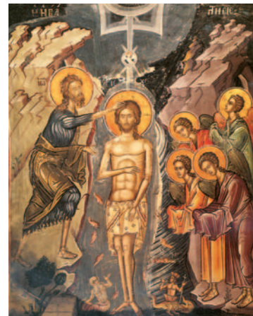
Με τη βάπτισή του, ο Χριστός μάς έδειξε τον τρόπο να έλθουμε κοντά του (εικόνα από την Ι. Μ. Σταυρονικήτα, Άγ. Όρος).

«Ακριβώς παιδιά μου! Όποιος δεν έχει παράθυρο αισθάνεται φυλακισμένος. Αναζητά το φως και λαχταρά να νιώσει τον καθαρό αέρα! Έτσι είναι και οι εικόνες. Θέλουμε να δούμε το Θεό, αλλά δεν μπορούμε. Μας επέτρεψε λοιπόν ο Θεός, να μαθαίνουμε μέσα από αυτές για τον Χριστό, την Παναγία και τους αγίους μας. Οι εικόνες είναι παράθυρα που, με τη βοήθεια της πίστης, μας ξεναγούν στον άγιο κόσμο του Θεού, στον ουρανό! Και πρέπει να γνωρίζετε ότι δεν έχει καμιά σημασία, εάν κάποιος γνωρίζει γράμματα ή όχι. Ένας άγιος της Εκκλησίας μας, μάλιστα, ονόμασε τις εικόνες "βιβλία των αγραμμάτων"».