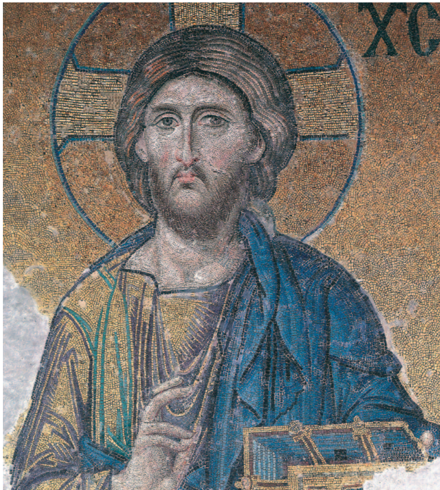
Εικ. 33 η : Ο Χριστός. Τμήμα από τη Δέση, ψηφιδωτό 13 ου αι. μ.Χ., Αγία Σοφία, Κωνσταντινούπολη.