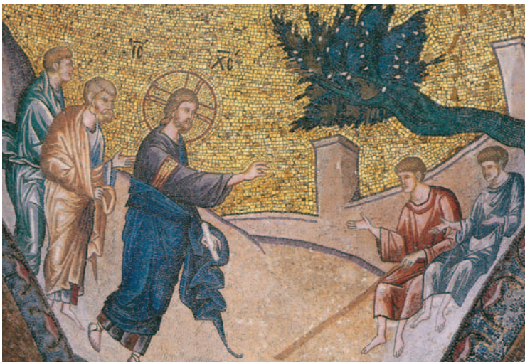
Εικ. 34 η : Η Θεραπεία των τυφλών, 14ος αι. μ.Χ., Μονή της Χώρας, Κωνσταντινούπολη.