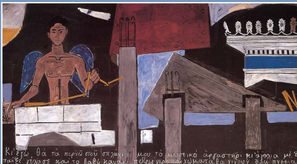
Γιάννης Τσαρούχης, Το πνεύμα της τεχνικής

Τα τέσσερα κείμενα που περιλαμβάνονται στην ενότητα αναφέρονται σε διάφορες βιωματικές καταστάσεις, ηθικά διλήμματα και δυσκολίες οικονομικής επιβίωσης, που αντιμετωπίζουν οι άνθρωποι από την παλιά ως τη σύγχρονη εποχή. Οι κρίσιμες αυτές περιστάσεις, οι οποίες τις περισσότερες φορές ξεπερνιούνται με την ψυχική αντοχή και την αγωνιστικότητα, επηρεάζουν σημαντικά τον άνθρωπο καθώς προσδιορίζουν τη σχέση του με το περιβάλλον και την εποχή του. Στο ποίημα του Κ.Π. Καβάφη εξαιρείται το ηθικό μεγαλείο των ανθρώπων που υπερασπίζονται συλλογικές αξίες. Το διήγημα της Έλλης Αλεξίου αναφέρεται στη μεταπολεμική δοκιμασία της εξορίας, τη φτώχεια και τις δύσκολες συνθήκες ζωής που αντιμετώπιζε καρτερικά η ελληνική κοινωνία και, περισσότερο, η μονογονεϊκή οικογένεια. Στο ανώνυμο κινέζικο ποίημα ο γεωργός ατενίζει με αισιοδοξία τη ζωή στηριγμένος στη χειρωνακτική εργασία του, περήφανος για την ανεξαρτησία του από την εξουσία του αυτοκράτορα.