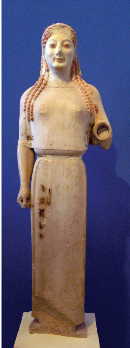
1. Η «Πεπλοφόρος» Κόρη από την Αθήνα, 530 π.Χ.

9η. Να παρατηρήσετε τα εικονιζόμενα έργα και να σημειώσετε: α) αν υπάρχει κρυφή γεωμετρία, εμφανής κατεύθυνση, έμφαση, επανάληψη, β) το είδος της διάταξης των στοιχείων.