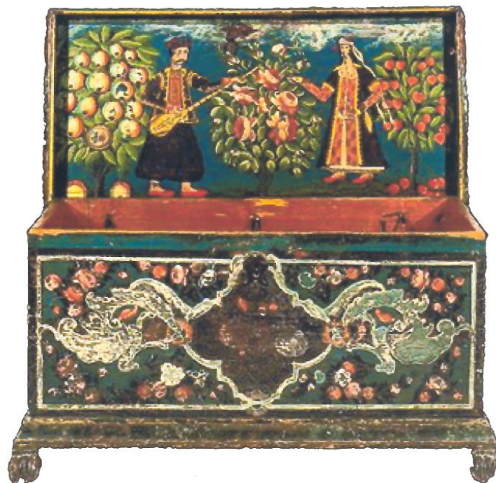
7. Λαϊκή ελληνική κασέλα.