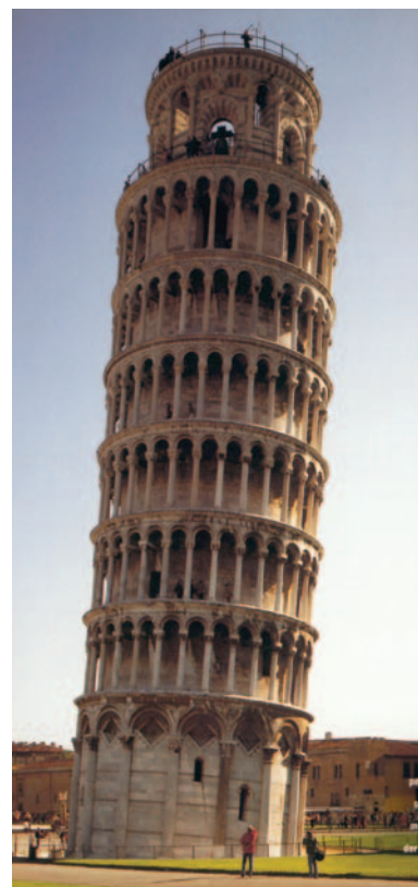
8. Ο πύργος της Πίζας, 12ος-13ος αι.