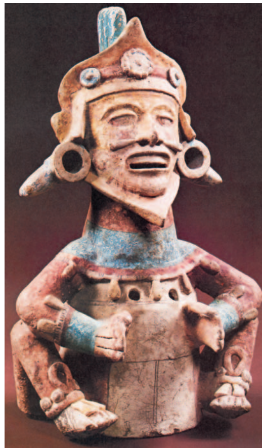
5. Ανθρωπόμορφο αγγείο, Μεξικό, 1200-1500.