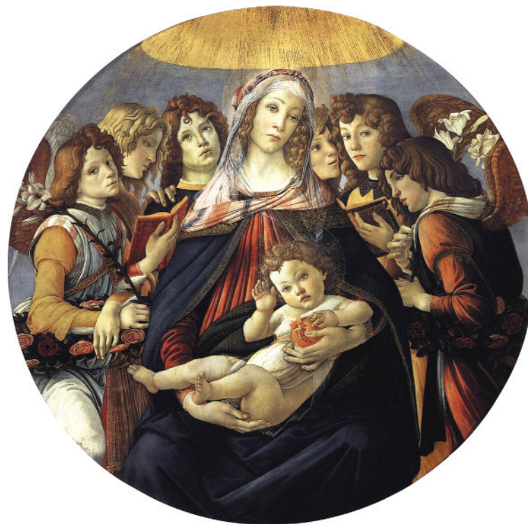
6. Μποτιτσέλι, «Η Παναγία με το ρόδι», 1478.