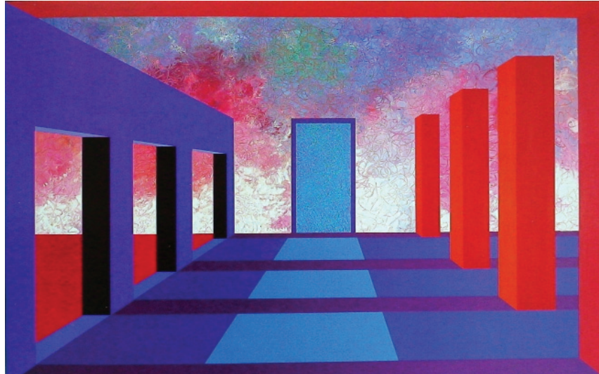
2. Ζούνη, «Μπλε πύλες - κόκκινοι κίονες - πύλη», 2006.