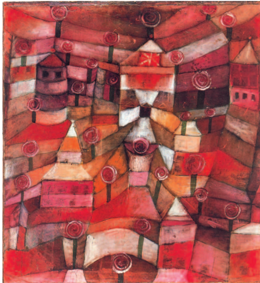
4. Κλέε, «Τριανταφυλλένιος κήπος», 1921.