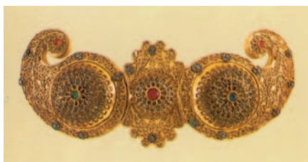
3. Παλαιά ελληνική πόρπη για ζώνη.