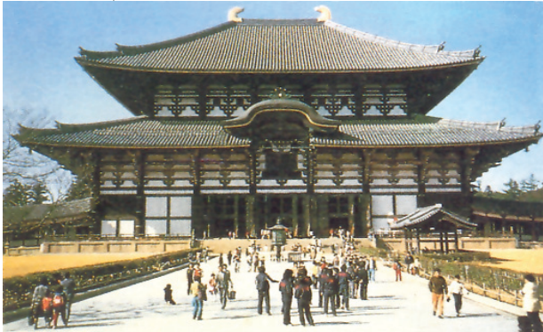
47. Ο ναός Τοντάι Τζι στη Νάρα, 760 - 765 μ.Χ., ξαναφτιάχτηκε το 16ο αι. και είναι το μεγαλύτερο ξύλινο κτίριο στον κόσμο.