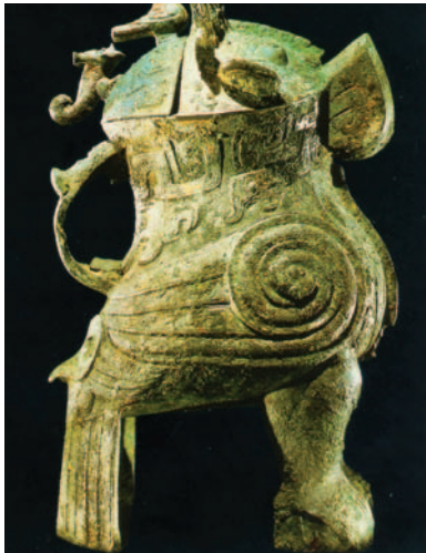
42. Ορειχάλκινο σκεύος για ποτό, 1125-771 π.Χ.

Όπως η καλλιγραφία, έτσι και η ζωγραφική γίνεται επάνω σε μετάξι ή χαρτί, με μελάνη και γαιοχρώματα. Με θέματα από τη φύση, τη θρησκεία και τους μύθους, το αισθητικό αποτέλεσμα συγκινεί με την κομψή του απλότητα, η οποία οφείλεται στην περίτεχνη τεχνική και την οικονομία των εικαστικών στοιχείων.