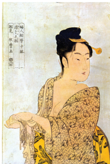
51. Ουταμάρο, «Πορτρέτο», 1800 μ.Χ.

Πώς αποδίδεται ο χώρος στις εικόνες 50,51,52;