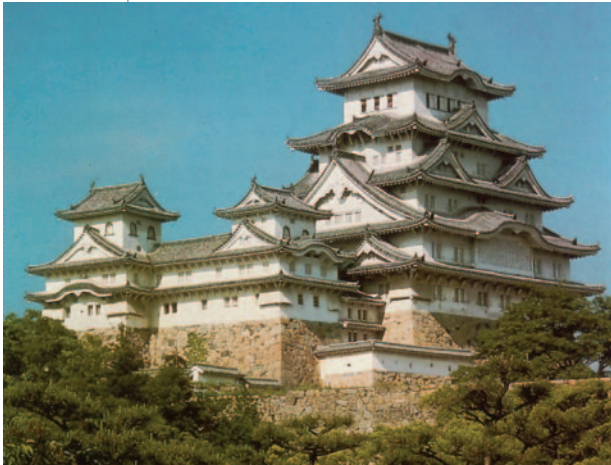
48. «Το κάστρο του Λευκού Ερωδιού», στο Χιμέζι, 17ος μ.Χ. αι.