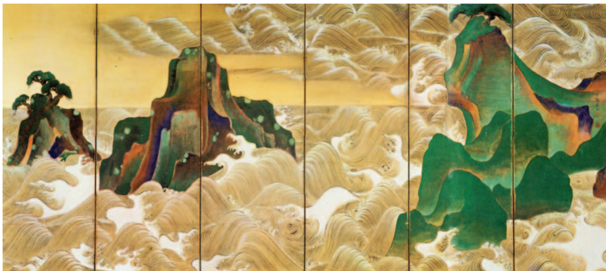
50. Κορίν, «Ματσουσίμα», ζωγραφιστό παραβάν, 18ος μ.Χ. αι.