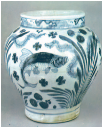
43. Κυανόλευκο πορσελάνινο βάζο, 14ος μ.Χ. αι.