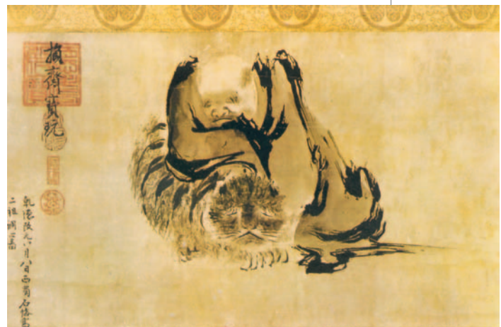
46. Σε Κο, «Πατριάρχης που εξαγνίζει την καρδιά του», 10ος μ.Χ. αι.