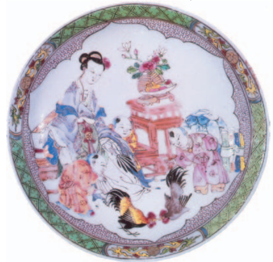
44. Πορσελάνινο δίσκος από τη «ροζ οικογένεια», 1720 μ.Χ.