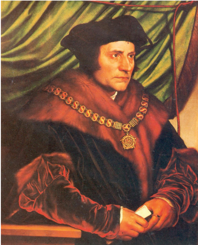
6. Χολμπάιν, «Ο κύριος Τόμας Μορ», 1527.

Όμως, ένας πίνακας ζωγραφικής έχει και την πραγματική υφή της επιφάνειάς του, η οποία διαφοροποιείται με το πλάσιμο των χρωμάτων (Εικ.7).