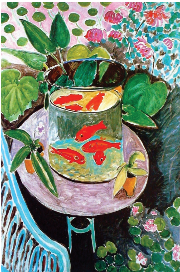
15. Ματίς, «Χρυσόψαρα», 1912.