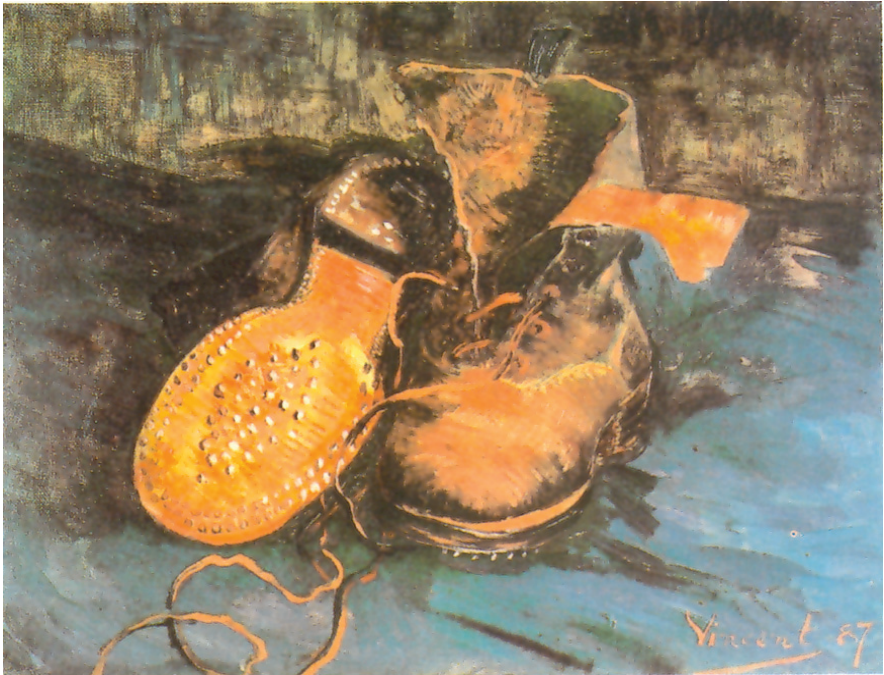
14. Βαν Γκογκ, «Ζευγάρι μπότες», 1887.