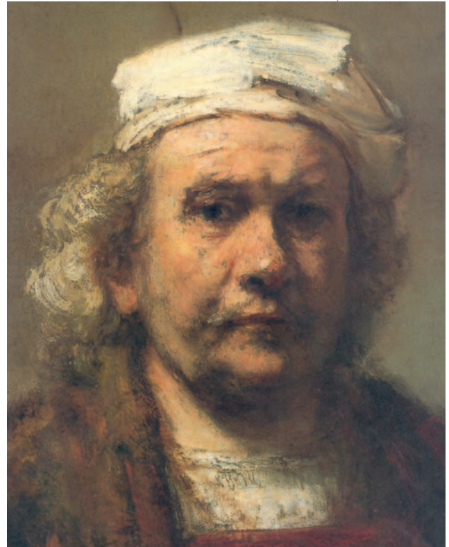
7. Ρέμπραντ, «Αυτοπροσωπογραφία», 1663 (Μπαρόκ*).

Ο Χολμπάιν απέδωσε τις υφές, ώστε η κουρτίνα, η γούνα, το βελούδο, το κόσμημα αλλά και το δέρμα της φηγούρας στο πρόσωπο και τα χέρια να φαίνονται σαν αληθινά.