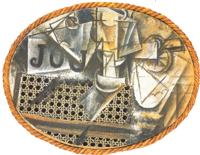
16. Πικάσο, «Νεκρή φύση με ψάθα καρέκλας», 1912.