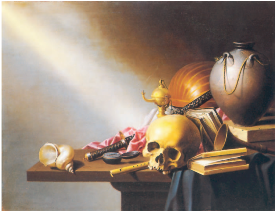
13. Στέινβαϊκ, «Αλληγορία των ματαιοτήτων της ανθρώπινης ζωής», 1650.

Τα αντικείμενα είναι συμβολικά, π.χ. η νεκροκεφαλή αναφέρεται στο θάνατο, τα βιβλία στη γνώση, το δοχείο του κρασιού στις απολαύσεις της ζωής.