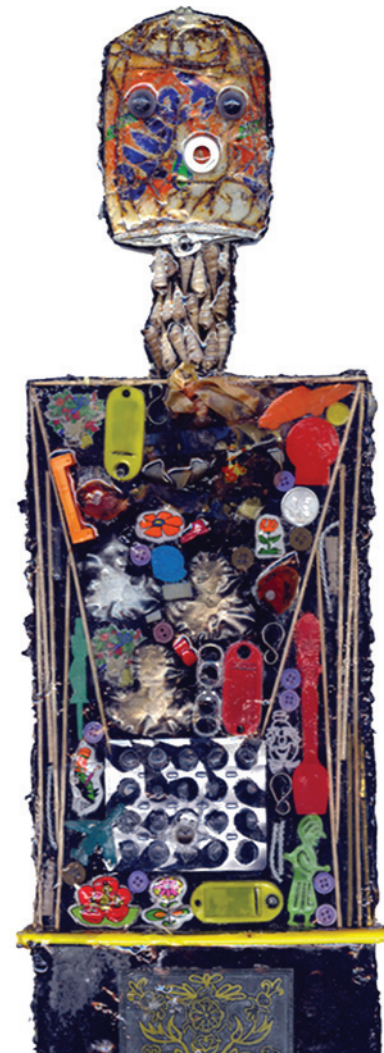
10. Αρφαράς, «Επιπεδόσχημο ειδώλιο της ηλεκτρονικής εποχής», 2004.

Ποια σημασία έχει η υφή στα έργα του Ερνστ, του Τάπιες και του Αρφαρά;