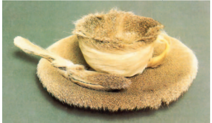
5. Μέρετ Οπενχάιμ, «Αντικείμενο», 1936.

Ποια αίσθηση σας προκαλούν το στιλβωμένο μάρμαρο στο γλυπτό του Μιχαήλ Αγγέλου, οι τραχιές επιφάνειες της φηγούρας του Τζιακομέτι και η τρίχινη υφή στο έργο της Μέρετ Οπενχάιμ; Πώς πιστεύετε ότι αυτές οι υφές συμβάλλουν στο νόημα του κάθε έργου;