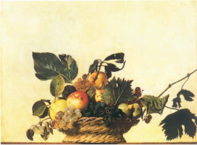
11. Καραβάτζιο, «Καλάθι με φρούτα», 1590. Το έργο θεωρείται η πρώτη σύνθεση με αποκλειστικό θέμα τη νεκρή φύση.

Η νεκρή φύση αποτελεί μια θεματική ενότητα της ζωγραφικής που απεικονίζει συνθέσεις με διάφορα αντικείμενα, όπως καλάθια με φρούτα, βάζα με λουλούδια, μουσικά όργανα κτλ. Παλαιότερα, όλα αυτά εμφανίζονταν συμπληρωματικά σε έργα με άλλο θέμα. Από το 16ο αιώνα οι ζωγράφοι ασχολήθηκαν αποκλειστικά με τα καθημερινά αυτά αντικείμενα, τα οποία απέδωσαν ρεαλιστικά, αναδεικνύοντας την υφή, τον όγκο τους αλλά και τη σημασία που είχαν στη ζωή των ανθρώπων.