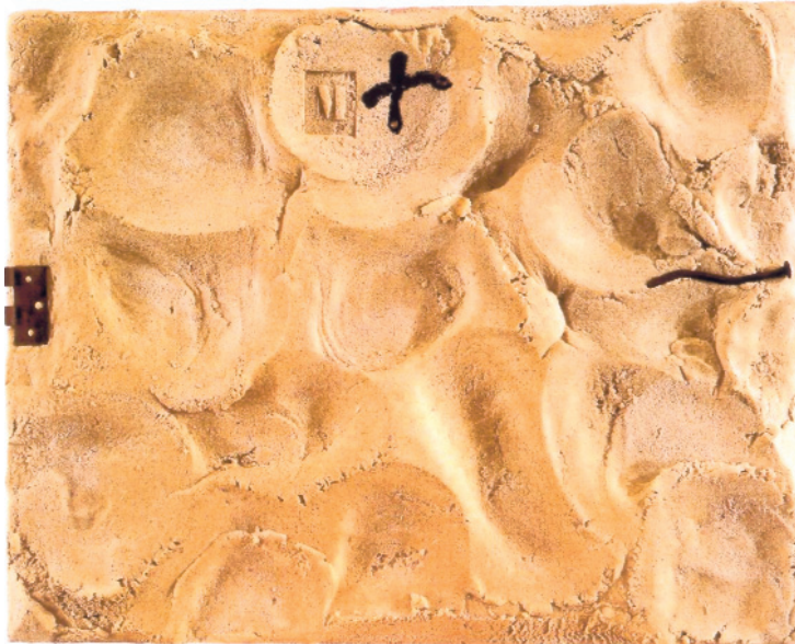
9. Τάπιες, «Ματιέρα», 1996.

8. Ερνστ*, «Τα μάτια της σιωπής», 1944. Ο Μαξ Ερνστ (ζωγράφος του Σουρεαλισμού*) χρησιμοποιεί τις υφές διαφόρων επιφανειών και με την τεχνική του ντεκολάζ, τις μεταφέρει επάνω στην επιφάνεια του πίνακα. Απλώνει πρώτα χρώμα επάνω σε μια επιφάνεια με τραχιά υφή, έπειτα πιέζει το μουσαμά επάνω, ώστε να κολλήσει το χρώμα σε αυτόν και τον αποκολλά. Στη συνέχεια ζωγραφίζει με το πινέλο και ολοκληρώνει το έργο.