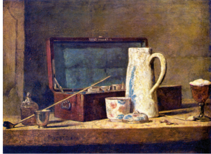
12. Σαρντέν, «Νεκρή φύση με πίπα», 1779. Λιτή απόδοση των καθημερινών αντικειμένων σε χώρο με ιδιαίτερο φωτισμό.