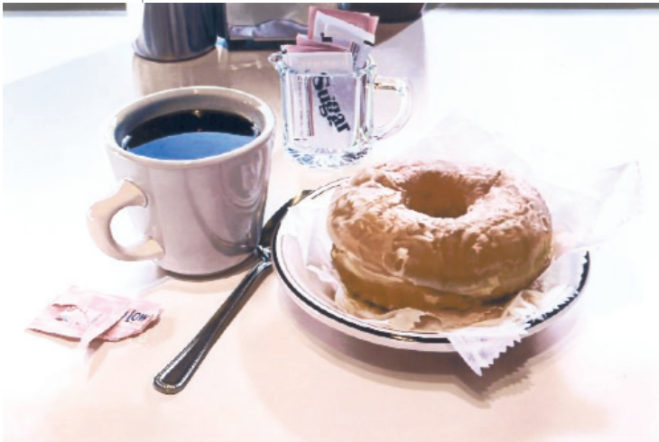
17. Γκόινγκς, «Απόλαυση», 1994.

Η νεκρή φύση συνεχίζει ακόμα να αποτελεί θέμα και πεδίο έρευνας στις εκφραστικές αναζητήσεις της σύγχρονης τέχνης.