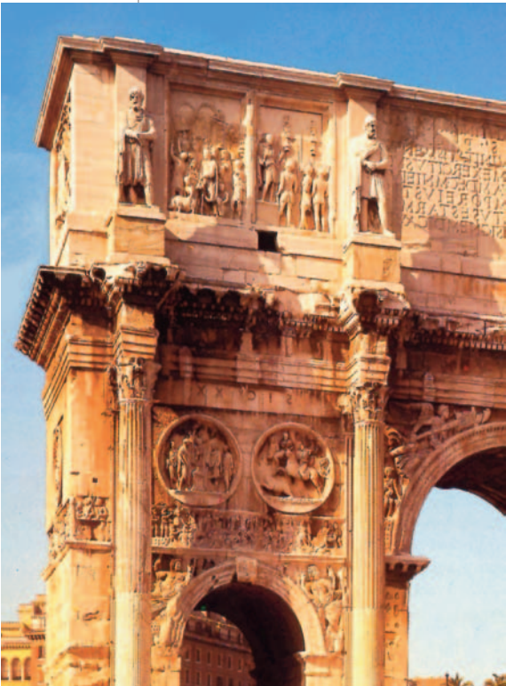
2. Η αψίδα του Κωνσταντίνου στη Ρώμη, 312-15.