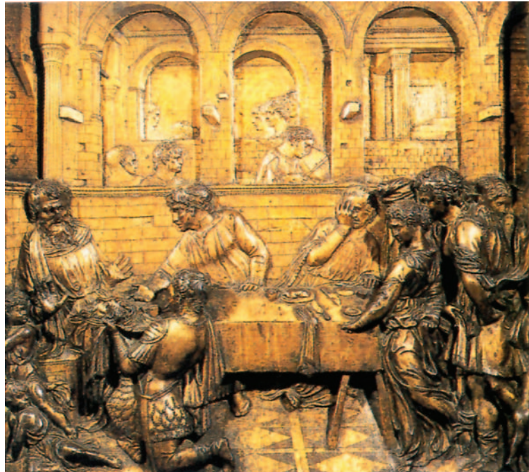
3. Ντονατέλο*, «Συμπόσιο του Ηρώδη», 1425.

Το μπρούτζινο ανάγλυφο από το Βαπτιστήρι της Σιένα χωρίζεται σε τρία επίπεδα, από το υψηλό μέχρι το χαμηλό. Στο πρώτο επίπεδο παρουσιάζονται οι καλεσμένοι της γιορτής, στο μεσαίο οι μουσικοί, ενώ στο πίσω παριστάνεται η εκτέλεση του Αγίου Ιωάννη του Βαπτιστή.