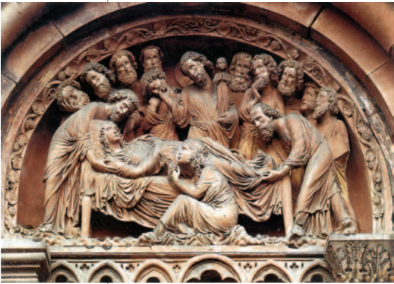
1. «Η Κοίμηση της Θεοτόκου», ανάγλυφο από το Γοτθικό καθεδρικό ναό του Στρασβούργου, περ. 1230. Οι μορφές είναι σχεδόν ολόγλυφες, ώστε ο θεατής να τις αντιλαμβάνεται ακόμα και από μεγάλη απόσταση.