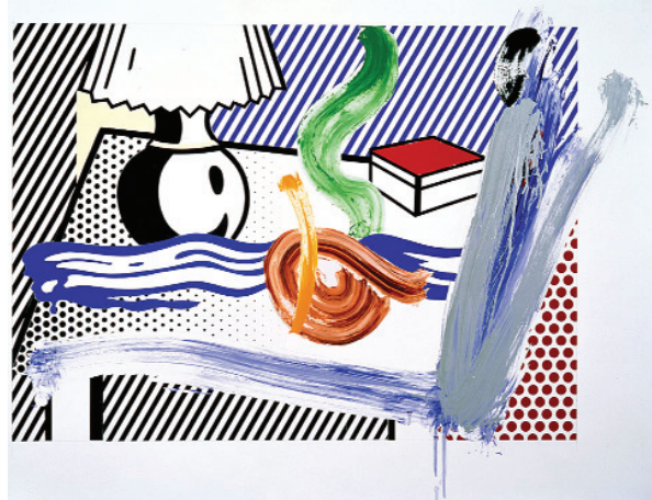
18. Λιχτενστάιν, «Κολάζ με πινελιές και νεκρή φύση», 1996.

Οι Φωτορεαλιστές, όπως ο Γκόινγκς, επηρεασμένοι από την αμεσότητα και την αλήθεια της φωτογραφίας, αντιγράφουν την πραγματικότητα ζωγραφικά σαν να τη βλέπουν μέσα από φωτογραφικό φακό.