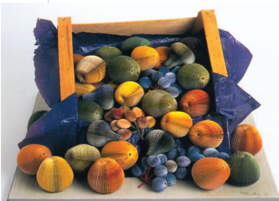
19. Παύλος, «Καφάσι με φρούτα», 1990-94.

Πώς χρησιμοποιούνται τα υλικά από τον Παύλο και τον Λιχτενστάιν στα έργα τους; Πώς σχετίζεται το έργο του Γκόινγκς με τη ζωή μας;