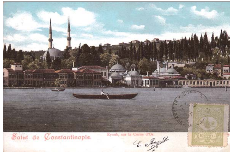
Η Κωνσταντινούπολη: Ο Κεράτιος κόλπος (επιστολικό δελτάριο)

αρχίσει, γινότανε ένα είδος ιεροτελεστίας. Μαζευόντανε όλες οι συμμορίες πίσω από την οθόνη, από όπου έβλεπε κανείς περίφημα, μονάχα που τα έβλεπε όλα ανάποδα, και τα πρόσωπα και τα γράμματα, μα αυτό δεν είχε ιδιαίτερη σημασία. Μόλις λοιπόν άρχιζε και σκοτεινίαζε κι είχε πια συναχτεί το παιδοθέμι❖ και αδημονούσε❖ και κλοτσούσε το χώμα, ερχότανε ένας όμιλος από υπάλληλους του Κήπου που κουβαλούσαν, με ύφος τελετουργικό, ένα πελώριο λάστιχο του ποτίσματος. Το συνδέανε με μια βρύση, το ξεδίπλωναν κι άρχιζαν να καταβρέχουν την οθόνη. Καμιά φορά το νερό δεν ερχότανε, οι υπάλληλοι έφερναν εργαλεία, γινότανε ιστορία ολόκληρη. Τέλος το νερό πιτσιλούσε με δύναμη το πανί κι οι συμμορίες, έξαλλες, χειροκροτούσαν, πετούσαν τα καπέλα τους στον αέρα και φώναζαν ζήτω. Κανείς δεν ήθελε να λείψει απ' αυτήν τη σκηνή.