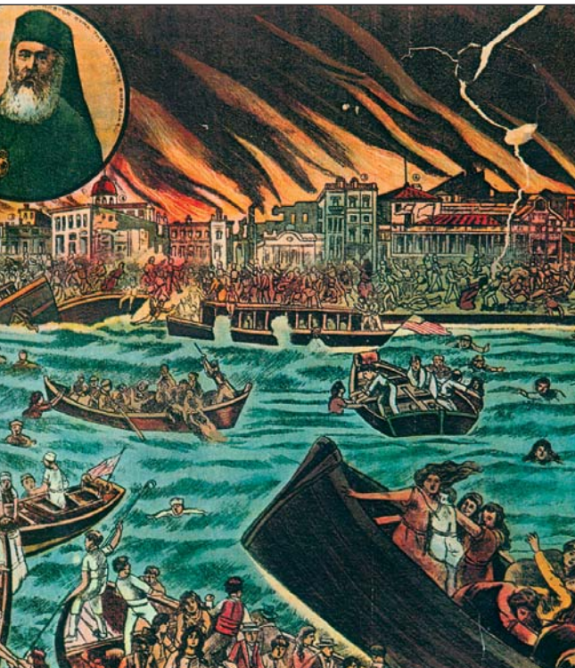
Σκηνή της καταστροφής της Σμύρνης (πάνω αριστερά εικονίζεται ο μητροπολίτης Χρυσόστομος) σε λαϊκή εικόνα της εποχής (Εθνικό Ιστορικό Μουσείο, λεπτομέρεια)

Στο απόσπασμα αυτό από το μυθιστόρημα Οι νεκροί περιμένουν η συγγραφέας Διδώ Σωτηρίου μάς μεταφέρει στην ατμόσφαιρα της Σμύρνης τον 1922, λίγα εικοσιτετράωρα πριν από την πυρπόληση της πόλης και τον ξεριζωμό των Μικρασιατών από τις εστίες τους. Η Δ. Σωτηρίου ψυχογραφεί τους ήρωές της και αφήνει να διαφανεί πόσο ανυπεράσπιστος είναι ο απλός άνθρωπος στις κρίσιμες στιγμές της Ιστορίας, όταν τα γεγονότα εξελίσσονται ραγδαία χωρίς να μπορεί ο ίδιος να μεταβάλει την πορεία τους.