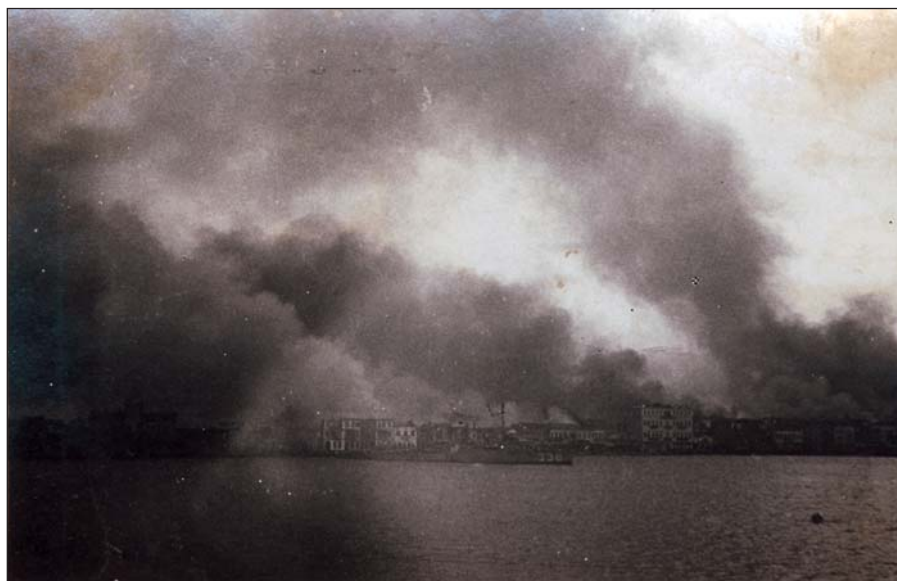
Η Σμύρνη στις φλόγες (φωτογραφία της εποχής)