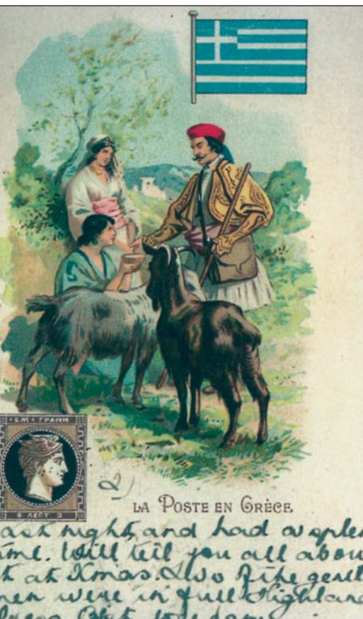
Ειδυλλιακή εικόνα Έλληνα ταχυδρόμου σε ταχυδρομικό δελετήριο

Το ποίημα αναφέρεται σε ένα παλαιό πρόβλημα του ελληνικού κόσμου, τον ξενιτεμό, ιδιαίτερα συνηθισμένο σε μερικές περιοχές (π.χ. στην Ήπειρο), λόγω ιστορικών, οικονομικών κ.ά. συνθηκών. Ο Ιωάννης Βηλαράς έζησε στα Γιάννενα την εποχή του Αλή πασά και ήρθε σε επαφή με τους λαϊκούς ανθρώπους και τη δημοτική ποίηση όπου το θέμα της ξενιτιάς είναι κυρίαρχο.