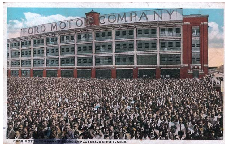
Το κτίριο της εταιρείας Φορντ στο Ντιτρόιτ των ΗΠΑ (επιστολικό δελτάριο)

– Τότε έκανες καλά. Εδώ μεγάλη φτώχεια. Ο κόσμος κιντυνεύει, σήκωσε φτερό ♦