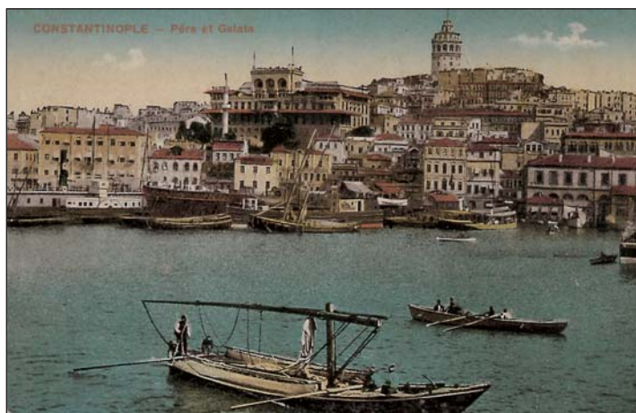
Η Κωνσταντινούπολη: Το Πέραν και ο Γαλατάς (επιστολικό δελτάριο)

Τα κυριότερα παιχνίδια τους ήτανε τα βαρελάκια, τα σκλαβάκια, ο μπίκος ♦ και το κλέφτικο. Τα βαρελάκια παιζόντανε με πολύ περίπλοκους κανονισμούς, περιορισμούς και διαγωνισμούς, που αν ήθελε κανείς να τα βάλει όλα αυτά στο χαρτί μπορούσε να γίνει ολόκληρη διατριβή. Όλοι όμως ήξεραν τους νόμους του παιχνιδιού, απέξω κι ανακατωτά, χωρίς να τους έχουνε διδαχτεί ποτέ. Ήτανε παραδομένοι από αμνημονεύτους χρόνους, μαζί με τους θρύλους του Βυζαντίου, τους άρπαζε κανείς μες στον αέρα του Κήπου τον ίδιο καιρό που μάθαινε και το άλφα-βήτα. Επίσης τα σκλαβάκια ήταν ένα παιχνίδι περίπλοκο που χρειαζότανε ευστροφία και τέχνη. Σ' αυτό λάβαιναν μέρος συχνά και κορίτσια και τότε παιζότανε με μεγάλη ευγένεια και αξιοπρέπεια. Ο μπίκος ήταν ένα παιχνίδι σκοποβολής, που παιζότανε με μεγάλες πλατιές πέτρες, κατά προτίμηση με κομμάτια μάρμαρο από σπασμένα τραπεζάκια του καφενείου, κι είχε κι αυτός τη νομοθεσία του, το κλέφτικο όμως ήταν ένα παιχνίδι ηρωικό. Τα παιδιά μοιραζόντανε σε δυο μερίδες που παράσταναν τους κλέφτες και τους αστυνόμους. Η κάθε μερίδα είχε τον αρχηγό της και το μοίρασμα