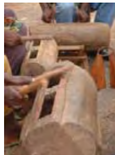
Τύμπανο με σχισμή (Slit drum)

Ένα δέντρο ή ένα συμπαγές κομμάτι ξύλου «σκάβεται» για να αφήσει ένα μεγάλου μήκους άνοιγμα στην πάνω πλευρά. Οι άκρες αυτής της σχισμής είναι άνισου πάχους και παράγουν δύο ήχους διαφορετικού τονικού ύψους. Μερικές φορές τοποθετείται κερί στο εσωτερικό της μιας πλευράς για να αλλιάξει το τονικό ύψος.