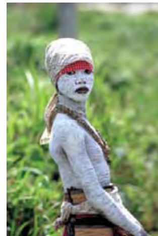
Τελετή για την είσοδο ενός κοριτσιού στην εφηβεία (Λιβερία)

Η μουσική, ο χορός και οι ιεροτελεστίες στην αφρικάνικη κοινότητα είναι αλληλένδετες. Εξάλλου, ο θεραπευτικός ρόλος της μουσικής στους πρωτόγονους αλλιά και στους σύγχρονους πολιτισμούς, είναι ένα γεγονός που επιβεβαιώνεται από τη σύγχρονη επιστήμη.