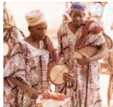
Μουσικοί της φυλής Γιορούμπα