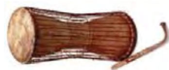
Τύμπανο που μιλά