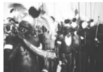
Τελετή της φυλής Λοτούσο (Σουδάν) για την ανομβρία