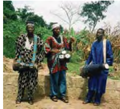
Μουσικοί από τη Δ. Αφρική

Κατά την εκτέλεση, ένας μουσικός μπορεί να αυτοσχεδιάζει ή να φτιάξει μια ιδιαίτερη παραλλαγή της μελωδίας, ενώ οι άλλοι τραγουδιστές συνεχίζουν την αρχική μελωδία.