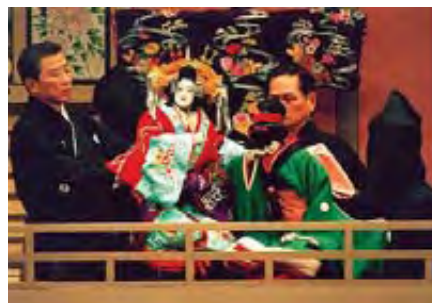
Το θέατρο μαριονέτας Μπουνρακού ιδρύθηκε στην Οσάκα το 1684

Η μουσική στην ιαπωνική παράδοση κατέχει μια περίοπτη θέση εδώ και αρκετές χιλιετίες, αφού οι πρώτες μαρτυρίες για την ύπαρξη μουσικής αναφέρουν πέτρινες σφυρίχτρες που χρονολογούνται στην 3η χιλιετία π.Χ. Η λαϊκή μουσική της χώρας του Ανατέλλοντος Ηλίου παρουσιάζει πολλά κοινά στοιχεία με τις μουσικές της Κίνας, της Κορέας, του Θιβέτ και έχει επιρροές από τη βουδιστική παράδοση της Ινδίας, γεγονός που σημαίνει ότι στην ιστορία της έχει δεχθεί πολλές επιδράσεις από τη μουσική των γειτονικών λαών.