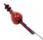
Τικτίρι, όργανο των γντευτών των φιδιών