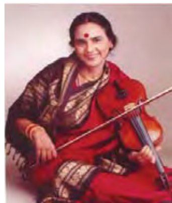
Ευρωπαϊκό βιολί με «ινδικό κράτημα»

Συνήθως πρόκειται για πλάγιους αυλούς ή με διπλή γλωττίδα (σαν το όμποε ή τον ελληνικό ζουρνά), όπως αυτά που χρησιμοποιούν οι γντευτές φιδιών.