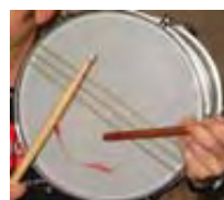
Καϊσα ντε γκέρο