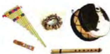
Πάνω: Ζαμπόνα, τσάιτσα, γουανκάρα. Κάτω: τάρκα, κένα

Τα κυριότερα ευρωπαϊκά όργανα που προτιμούν οι Ινδιάνοι είναι τα έγχορδα, όπως το τσαράνγκο με ισπανική προέλευση.