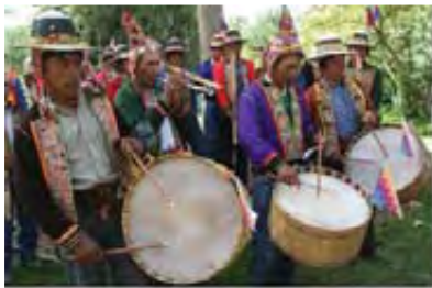
Μουσικοί της φυλής Κέτσουα

Παρουσιάζουν έντονες επιρροές από την ευρωπαϊκή μουσική -λόγω των Ισπανών κατακτητών- αλλά καθόλου από την αφρικανική.