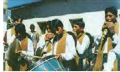
Μουσικοί της φυλής Αϊμάρα

Η ινδιάνικη μουσική των φυλών «Κέτσουα» (Quechua) και «Αϊμάρα» (Aymara) στην περιοχή των Άνδεων περιλαμβάνει τραγούδια της δουλειάς, επικά, θρήνους, της διασκέδασης και τελετουργικά τραγούδια, τα κείμενα των οποίων διατηρούν τους μύθους της κάθε φυλής.