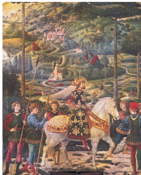
Ιωάννης Η΄ Παλαιολόγος στη Φλωρεντία. Πίνακας του Β. Gozzoli. Ανάκτορο των Μεδίκων, Φλωρεντία

Οι προσπάθειες πάντως «ίνα πάντες ἔν ὄσιν» (για την ενότητα της Εκκλησίας) δε σταμάτησαν ποτέ. Στα δύσκολα χρόνια της Τουρκοκρατίας ήταν αδύνατη κάθε απόπειρα για έναν εκκλησιαστικό διάλογο. Στον εικοστό, όμως, αιώνα έγιναν βήματα προόδου σε επίπεδο διαλόγου και επικοινωνίας μεταξύ του Ανατολικού και Δυτικού Χριστιανισμού.