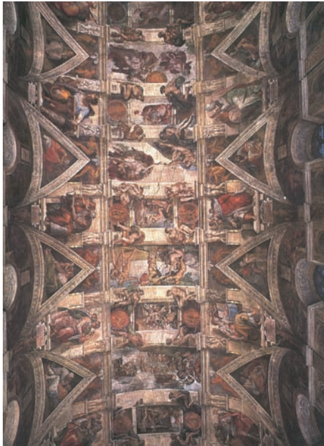
11. Ο θόλος της Καπέλα Σιξτίνα. Έργο του Μιχαήλ Αγγελου. Νωπογραφία