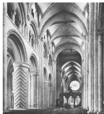
2. Καθεδρικός ναός Ντάρραμ. Ρομανικός ρυθμός. Κεντρικό κλίτος.