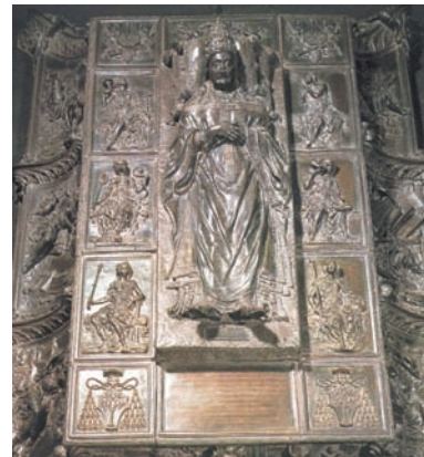
9. Μνημείο του Σίξτου Δ'. Εποχή Αναγέννησης.