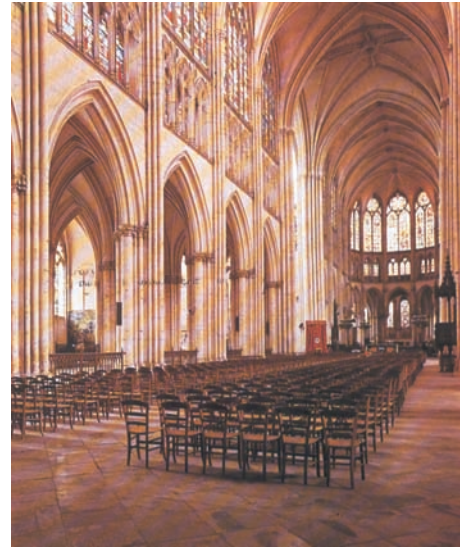
5. Εσωτερικό του ναού της Τρουά. Γαλλία. Γοτθική αρχιτεκτονική.

Οι ναοί αυτοί θυμίζουν κάστρο. Η εικόνα τους είναι επιβλητική, δίνουν την αίσθηση σταθερότητας, ασφάλειας και δύναμης. Οι δυνατοί πέτρινοι τοίχοι που ύψωναν οι νεοβαπτισμένοι τεχνίτες του ναού εκφράζουν την πίστη τους στην ικανότητα της Εκκλησίας να μάχεται τις δυνάμεις του Σκότους ως την ημέρα της Κρίσης. Η διακόσμηση με ανάγλυφα είναι αυστηρή και εντυπωσιακή. Οι εικόνες ρομανικού ρυθμού, νωπογραφίες και ψηφιδωτά, θυμίζουν αρκετά τις βυζαντινές εικόνες και χαρακτηριστικό τους είναι οι σχηματοποιημένες, αλύγιστες μορφές (εικ. 4).