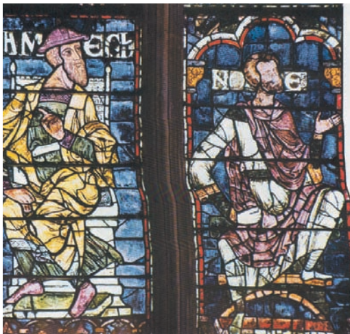
6. Σαμουήλ και Νώε. Υαλογραφήματα (vitraux) στη Μητρόπολη του Καντέρμπουρι, Αγγλία. 12ος αι.

Το 12ο αιώνα οι τεχνίτες στη Γαλλία δημιούργησαν το γοτθικό ρυθμό (εικ. 5). Κράτησαν μόνο τον πέτρινο σκελετό από το ρομανικό ρυθμό και μετέτρεψαν τις στρογγυλές του αψίδες σε αιχμηρές. Στη θέση των τοίχων μπήκαν μεγάλα παράθυρα με υαλογραφήματα (βιτρώ), (εικ. 6). Χάρη σ' αυτά οι ναοί έγιναν εντυπωσιακοί εσωτερικά και εξωτερικά. Ο θόλος τώρα είναι ψηλότερος. Το βάρος εξαφανίζεται και το κτίριο δίνει την εντύπωση ότι υψώνεται με φορά προς τα επάνω. Στα γλυπτά και στις εικόνες οι μορφές βελτιώνονται, επίσης, ως προς την κίνηση (εικ. 7).