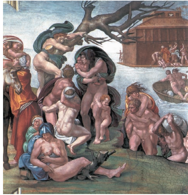
12. Ο Κατακλυσμός του Μιχαήλ Αγγελου. Νωπογραφία στην Καπέλα Σιξτίνα.