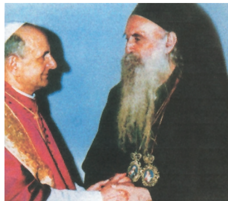
Ο Οικ. Πατρ. Αθηνάγορας Α' και ο Πάπας Παύλος ΣΤ' (25/7/1967), οι πρωτεργάτες του διαλόγου Ανατολής και Δύσης.

Το Σχίσμα των Εκκλησιών Ανατολής και Δύσης είναι πια πραγματικότητα.