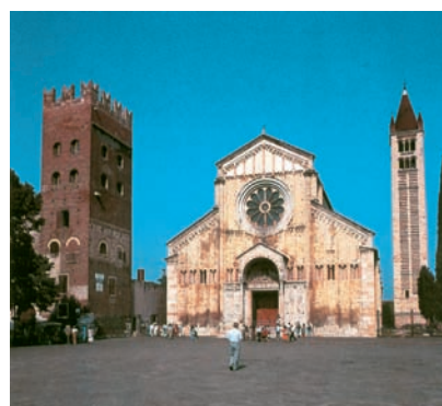
3. Αγ. Ζήνων, Βερόνα, Ιταλία. Ρομανικός ρυθμός.