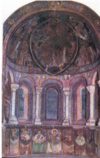
4. Κόγχη με τόν Χριστό εν δόξη. Βουργουνδία 12ος αι. Ρομανική ζωγραφική.