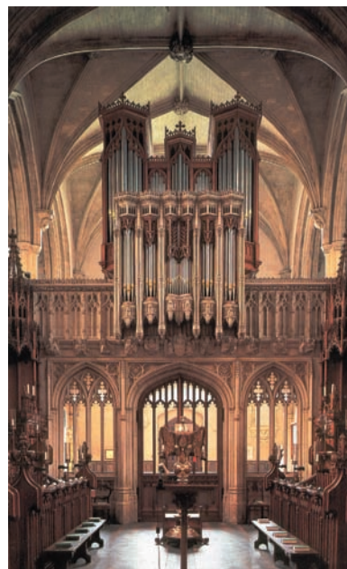
Εκκλησιαστικό όργανο που χρησιμοποιούν οι ρωμαιοκαθολικοί.

Το Γρηγοριανό Μέλος το διακρίνει ο ελεύθερος ρυθμός και δε χωρίζεται σε μέτρα, επειδή το κείμενο που ψάλλεται δεν είναι διαμορφωμένο σε στίχους, αλλά είναι σε μορφή πεζού λόγου. Όταν το Γρηγοριανό Μέλος άρχισε σιγά-σιγά να παραγκωνίζεται, άλλα μουσικά εκκλησιαστικά είδη δημιουργήθηκαν και πέρασαν στο προσκήνιο. Έτσι, τον 9ο και το 10ο μ.Χ. αι. εμφανίστηκε το απλό όργανο (organum), όρος που δηλώνει τις πρώτες μορφές πολυφωνίας. Στην αρχή ήταν αυτοσχέδιο τραγούδι. Πάνω σε ένα Γρηγοριανό Μέλος αυτοσχεδίαζαν μια δεύτερη μελωδία, την αντιφωνή, ενώ η πολυφωνία, με την ουσιαστική σημασία του όρου, «επινοήθηκε» στα τέλη της 1ης χιλιετίας μ.Χ. Το Γρηγοριανό Μέλος, επομένως, αποτέλεσε τη βάση της ευρωπαϊκής μουσικής .