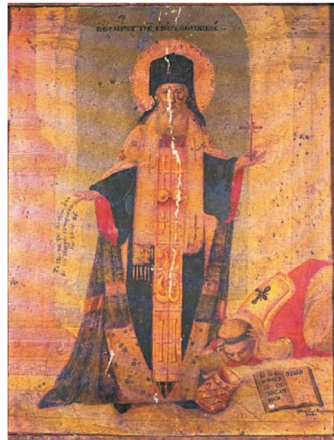
Άγ. Μάρκος ο Ευγενικός Υπέρμαχος της Ορθοδοξίας στη Σύνοδο Φεράρας-Φλωρεντίας. Εικόνα του 18ου αι.

Η ανάμειξη των αποκλειστικών αυτών ιδιοτήτων των προσώπων της Αγίας Τριάδας δημιουργεί σύγχυση και ακυρώνει την κοινωνία τους στη βάση της ισότητας και της διαφοράς. Με την εκπόρευση του Αγίου Πνεύματος και από τον Πατέρα και από τον Υιό δεν έχουμε μόνο διαρχία στην Αγία Τριάδα αλλά και μία σαφή υποτίμηση του Αγίου Πνεύματος.