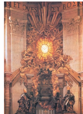
10. Θρόνος του Αγ. Πέτρου. Έργο του Μπερνίνι. Βατικανό.