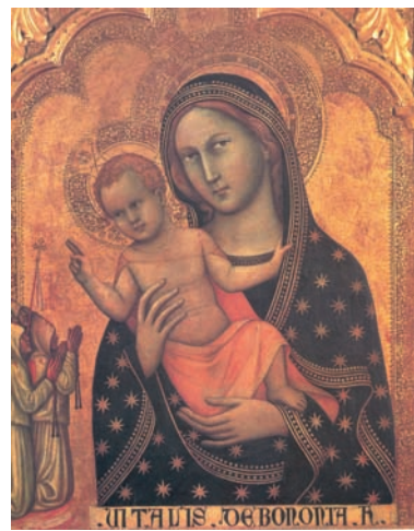
7. Η Παρθένος και το Βρέφος. (Βιτάλε Ντα Μπολόνια). Γοτθικός ρυθμός. 14ος αι. Μουσ. Βατικανού.