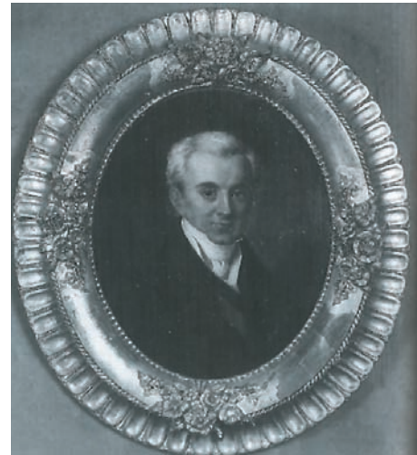
Ο πρώτος κυβερνήτης της Ελλάδας Ι. Καποδίστριας.

Ο πρώτος κυβερνήτης της Ελλάδας, Ιωάννης Καποδίστριας, δεν πρόλαβε να ασχοληθεί με το θέμα των σχέσεων της Εκκλησίας της Ελλάδας με το Οικουμενικό Πατριαρχείο, εξαιτίας των πολλών προβλημάτων του νεοσύστατου κράτους και της δολοφονίας του το 1831.