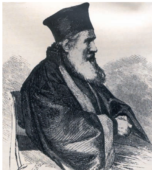
Θεόκλητος Φαρμακίδης, Γεννάδειος Βιβλιοθήκη, Αθήνα.

ο Μάουρερ εξασφάλισε με νόμο τη δυνατότητα να συγκαλεί σύνοδο και εκεί μεθόδευσε το θέμα του χωρισμού της Εκκλησίας της Ελλάδας από το Οικουμενικό Πατριαρχείο. Πολύτιμος βοηθός του στο έργο αυτό και πρωτεργάτης στη διαμόρφωση των εκκλησιαστικών πραγμάτων υπήρξε ένας εκκλησιαστικός άνδρας της εποχής, ο Θεόκλητος Φαρμακίδης. Ο Φαρμακίδης, σπουδασμένος στην Ευρώπη συμφωνούσε με τις αντιλήψεις περί εθνικής Εκκλησίας ανεξάρτητης από το Πατριαρχείο. Στο ακριβώς αντίθετο άκρο, η άλλη μεγάλη προσωπικότητα αυτής της περιόδου, ο ιερέας, ρήτορας και συγγραφέας Κωνσταντίνος Οικονόμος πολέμησε με το λόγο και την πένα του το χωρισμό της Εκκλησίας της Ελλάδας από το Πατριαρχείο. Ο χωρισμός αυτός τελικά υπογράφηκε το 1833 από 22 ιεράρχες στη