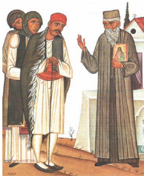
Μοναχός διδάσκει τους Χριστιανούς. Έργο του Γ. Κόρδη

και γραφή χρησιμοποιώντας τα λειτουργικά εκκλησιαστικά βιβλία και κυρίως το Ψαλτήρι. Στη λαϊκή μνήμη η δράση αυτή των ιερωμένων-δασκάλων έμεινε γνωστή ως «κρυφό σχολειό». Σημαντικοί δάσκαλοι της περιόδου της Τουρκοκρατίας (διδάσκαλοι του Γένους) υπήρξαν οι Ηλίας Μηνιάτης (1669-1714), Ευγένιος Βούλγαρης (1716-1806), Νικηφόρος Θεοτόκης (1731-1800), και οι άγιοι Κοσμάς ο Αιτωλός (1714-1779), Μακάριος ο Νοταράς (1731-1805) και Νικόδημος ο Αγιορείτης (1749-1809). Με τις συγγραφές και τα κηρύγματά τους, που ήταν διατυπωμένα στη γλώσσα του λαού, διατήρησαν την χριστιανική πίστη, την εθνική μνήμη και την ελληνική γλώσσα ζωντανές στη συνείδηση του λαού.