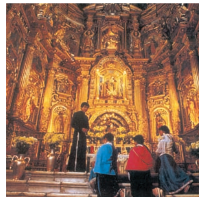
Εσωτερικό Ρωμαιοκαθολικού ναού στη Ν.Α. Ασία.