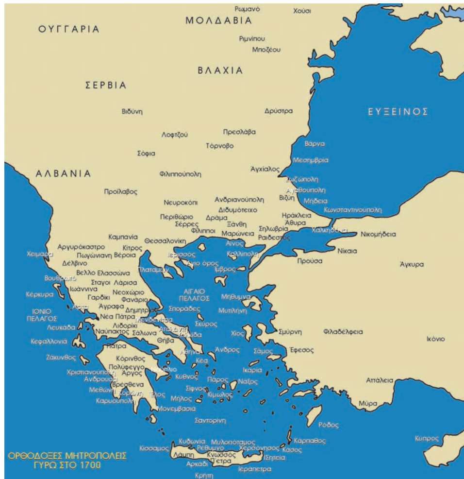
Οι Μητροπόλεις της υπόδουλης Ελλάδας μέχρι την ανακήρυξη του Αυτοκέφαλου.

ο Μάουρερ εξασφάλισε με νόμο τη δυνατότητα να συγκαλεί σύνοδο και εκεί μεθόδευσε το θέμα του χωρισμού της Εκκλησίας της Ελλάδας από το Οικουμενικό Πατριαρχείο. Πολύτιμος βοηθός του στο έργο αυτό και πρωτεργάτης στη διαμόρφωση των εκκλησιαστικών πραγμάτων υπήρξε ένας εκκλησιαστικός άνδρας της εποχής, ο Θεόκλητος Φαρμακίδης. Ο Φαρμακίδης, σπουδασμένος στην Ευρώπη συμφωνούσε με τις αντιλήψεις περί εθνικής Εκκλησίας ανεξάρτητης από το Πατριαρχείο. Στο ακριβώς αντίθετο άκρο, η άλλη μεγάλη προσωπικότητα αυτής της περιόδου, ο ιερέας, ρήτορας και συγγραφέας Κωνσταντίνος Οικονόμος πολέμησε με το λόγο και την πένα του το χωρισμό της Εκκλησίας της Ελλάδας από το Πατριαρχείο. Ο χωρισμός αυτός τελικά υπογράφηκε το 1833 από 22 ιεράρχες στη