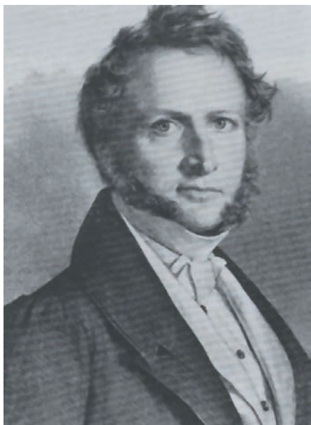
Μάουρερ, Υπουργός Εκκλησιαστικών του Όθωνα.

Σύνοδο του Ναυπλίου. Από αυτούς οι περισσότεροι προέρχονταν από υπόδουλες στους Οθωμανούς περιοχές και όχι από ελλαδικές (δεν υπήρχε δηλαδή σωστή αντιπροσώπευση των περιοχών της ελεύθερης Ελλάδας). Έτσι η Εκκλησία της Ελλάδας αποκόπηκε πραξικοπηματικά από το Οικουμενικό Πατριαρχείο.