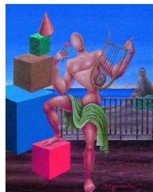
Νίκος Εγγονόπουλος (1910-1986) Ορφείας, 1972 Λάδι σε μουσαμά (55εκ. Χ 46εκ.)