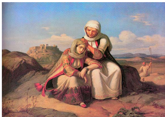
Θεόδωρος Βρυζάκης (1814/9;-1878). Η παραμυθία, 1847. Λάδι σε μουσαμά (44εκ. X 57εκ.).