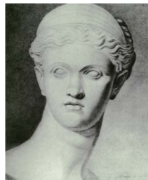
Ν. Μοσχοβάκης Σπουδὴ ἀγάλματος, 1937 Μολύβι σε χαρτί (1εκ. X 33εκ.)