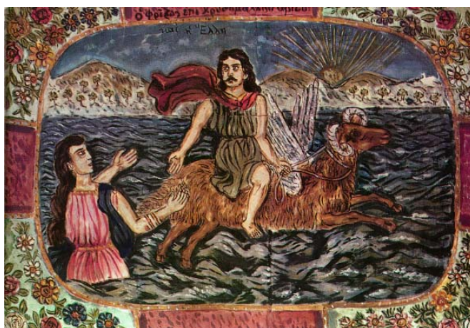
Θεόφιλος (1878-1934). Ο Φρίξος ἐπὶ χρυσομάλλου κριοῦ καὶ ἡ Ἑλλη (68εκ. X 100εκ.).