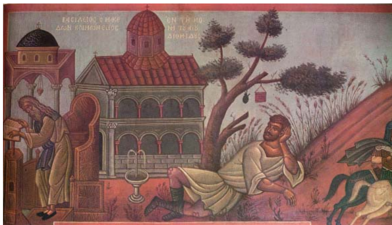
Φώτης Κόντογλου (1896-1965). Βασίλειος ο Μακεδών κοιμώμενος... . Λεπτομέρεια τοιχογραφίας (111εκ. Χ 28μ.).