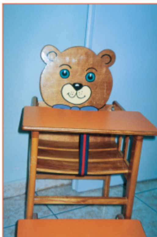
Εικόνα 1.2.1. ζ Καρεκλάκι στην αίθουσα βρεφών