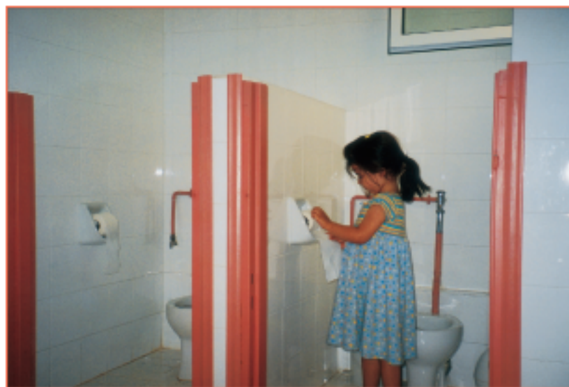
Εικόνα 1.2.1.1 Χώρος υγιεινής νηπίων