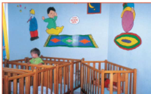
Εικόνα 1.2.1.θ Αίθουσα ύπνου-ανάπαυσης βρεφών