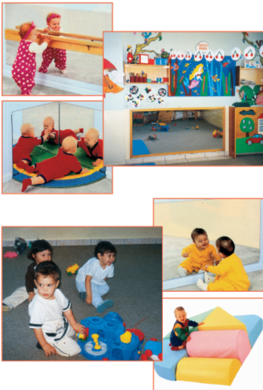
Εικόνα 1.2.1. στ Αίθουσα απασχόλησης βρεφών