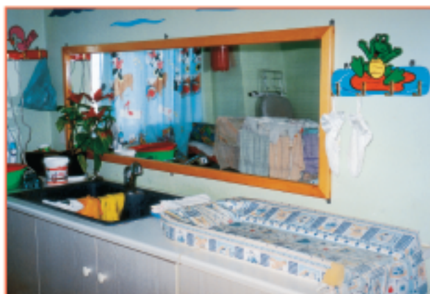
Εικόνα 1.2.1.η Χώρος αλλαγής-υγιεινής βρεφών