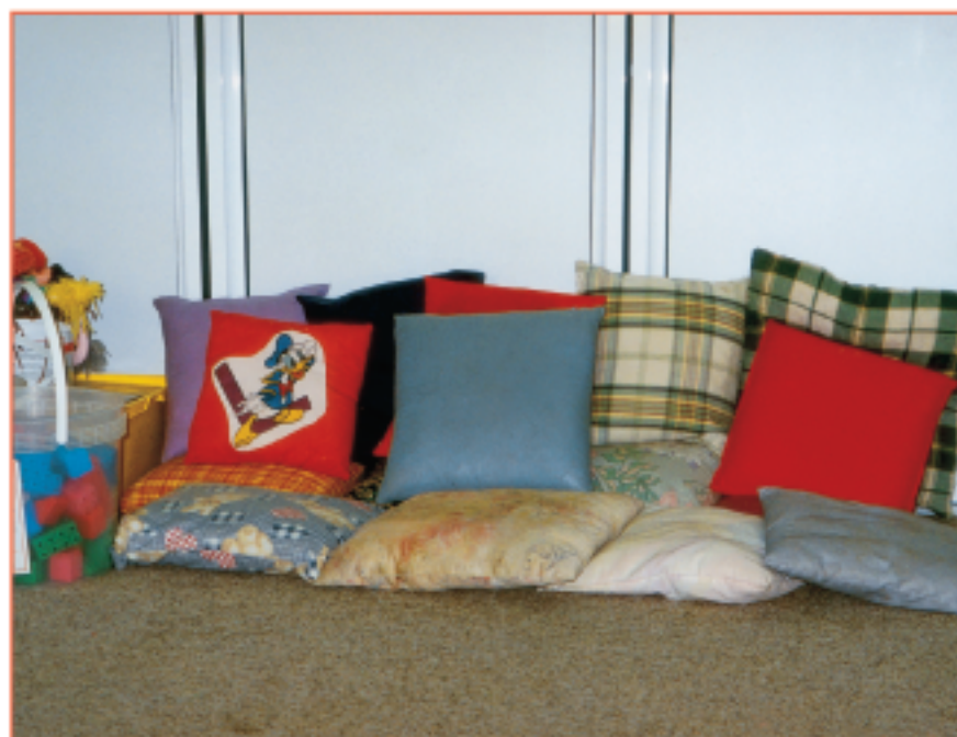
Εικόνα 1.2.1.ε Μαξιλάρια στην αίθουσα βρεφών