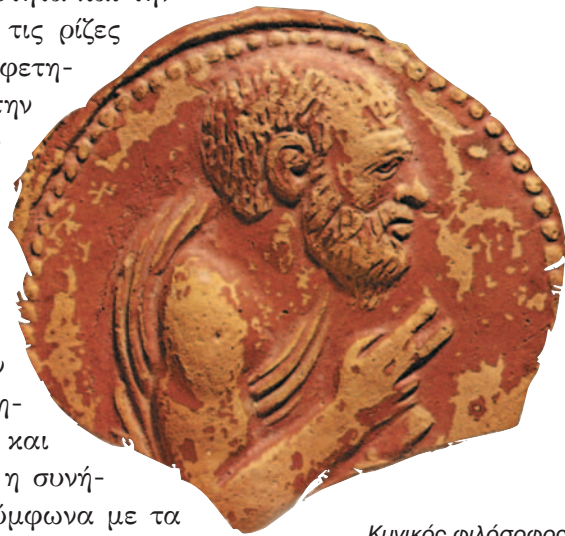
Κυνικός φιλόσοφος. Αθήνα, Μουσείο Αγοράς

Ο σκεπτικισμός ( σκέψις = διαλογισμός ή έρευνα) είναι φιλοσοφικό ρεύμα που αρνείται κάθε γνώση, αμφισβητώντας την αυθεντικότητα και την ισχύ γενικώς αποδεκτών αληθειών. Έχει τις ρίζες του στον 4ο αι. π.Χ. («οὐδὲν οἶδα») και αφετηρία του είναι η ελπίδα να κατακτήσουμε την ψυχική ηρεμία ( ἀταραξίαν ). Ιδρυτής του είναι ο Πύρρων (365-275 π.Χ.) από την Ήλιδα, ο εισηγητής του φιλοσοφικού δόγματος του πυρρωνισμού (ως αρχαίας σκέψης) και της ἐποχῆς (= αναστολή, επιφύλαξη ως προς τη γνώση), η οποία αναφέρεται στη φύση των υλικών αντικειμένων που είναι απρόσιτα στον άνθρωπο. Αναζητήσε την ευτυχία στην αποχή από κάθε κρίση και ορισμό ( ἀφρασία ). Υποστήριζε ακόμη πως η συνήθεια και η συμβατικότητα (=σύμβαση), σύμφωνα με τα πρότυπα της κοινωνίας, διέπουν τις ανθρώπινες πράξεις.