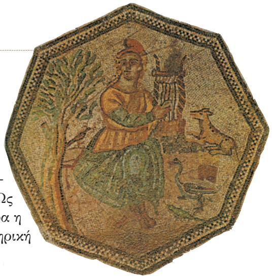
Ψηφιδωτό του 3ου αιώνα μ.Χ. από την «οικία του Μενάνδρου» στη Μυτιλήνη

Βασικά χαρακτηριστικά της αλεξανδρινής ποίησης είναι η μικρή έκταση των ποιημάτων, η θεματική πρωτοτυπία, το λόγιο ύφος, η εξεζητημένη (= επιτηδευμένη και όχι φυσική) γλώσσα, με τάση προς το παράδοξο, ο ρεαλισμός με σκηνές της καθημερινής ζωής. Ως γλώσσα χρησιμοποιείται η δωρική διάλεκτος, ιδιαίτερα η δυτική της Σικελίας (Δωρική Κοινά), αλλά και η ομηρική και η αττική.