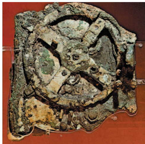
Το αστρονομικό μηχάνημα του 1ου αιώνα π.Χ. (βρέθηκε στο ναυάγιο των Αντικυθήρων). Εθνικό Αρχαιολογικό Μουσείο

Ο Συρακόσιος Αρχιμήδης (287-212 π.Χ.) σπούδασε στην Αλεξάνδρεια, αλλά έζησε στην πατρίδα του: είναι ο μεγαλύτερος μαθηματικός της αρχαιότητας και πολυγραφότατος συγγραφέας (έγραψε στη δωρική διάλεκτο). Έγινε διάσημος για τις μηχανικές εφευρέσεις του (μοχλοί, πολεμικές μηχανές για την πυρπόληση του ρωμαϊκού στόλου, μέτρηση του κύκλου, αρχή της άνωσης των υγρών «εύρηκα» κτλ.). Σκοτώθηκε κατά την άλωση των Συρακυσών από τους Ρωμαίους.