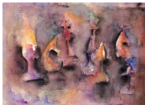
Νικόλας Σφήκας (1961- ). Η μπαλάντα. Ακουαρέλα (33εκ. X 45εκ.).