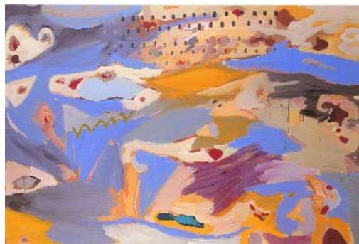
Σπύρος Τσιούμας (1954- ). Τα πιο ωραία παραμύθια, 1993. Ακρυλικά σε μουσαμά (150εκ. Χ π. 220εκ.).