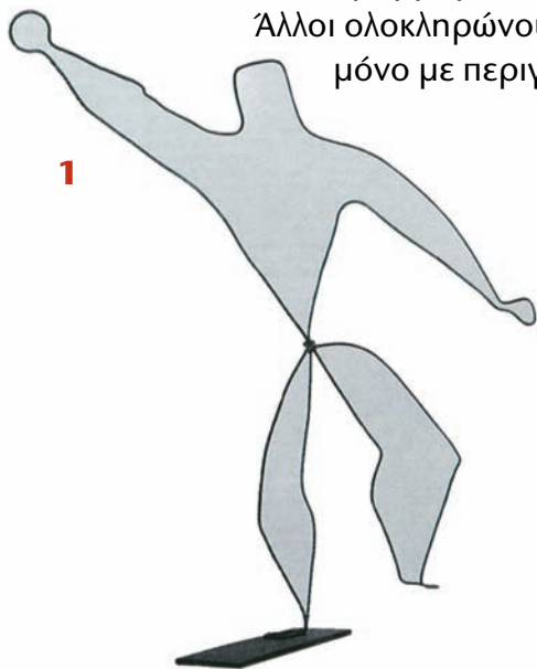
Το συρμάτινο γλυπτό του Κάλντερ είναι ένα περίγραμμα ανθρώπου (εικ. 1).

Ο Πικάσο στο εργαστήρι του σχεδιάζει με περιγράμματα ένα τοπίο (εικ. 2).