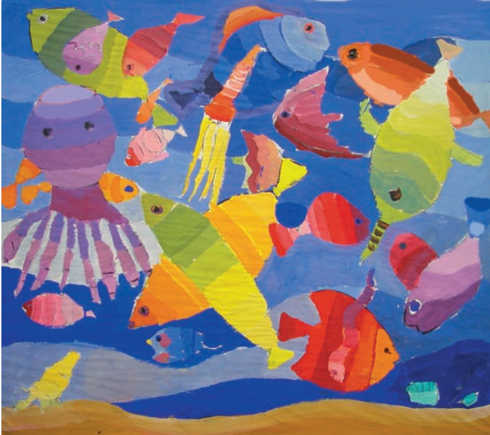
Χρώματα στα σκοτάδια του βυθού (εικ.1).