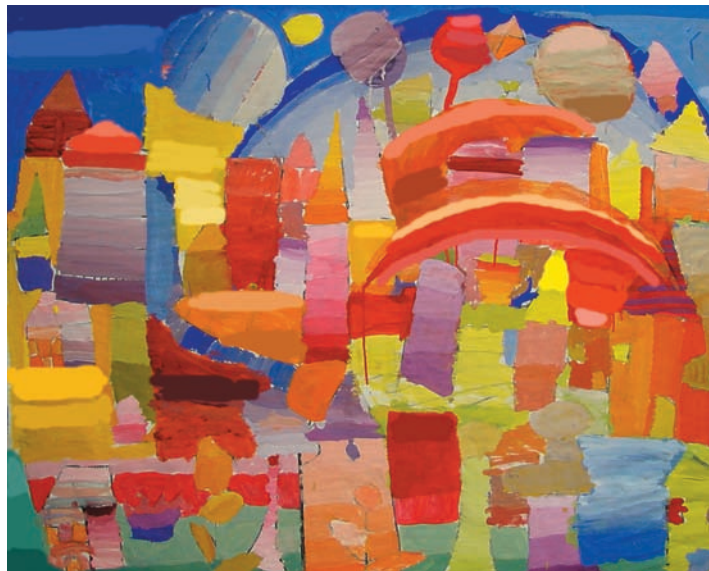
Το χαμόγελο του ουράνιου τόξου (εικ. 2).