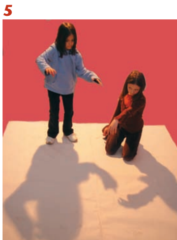
Παίζουμε με τις σκιές μας και τις προβάλλουμε στο πάτωμα (εικ. 5).