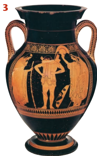
«Ο Έκτορας ετοιμάζεται για τη μάχη». Ερυθρόμορφο αγγείο (εικ. 3, 4).