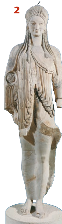
«Η κόρη της Ακρόπολης» (ΕΙΚ. 2).

Οι κόρες έχουν τα ίδια χαρακτηριστικά αλλά φορούν βαρύ πέπλο που σκεπάζει το σώμα τους. Είναι γλυπτά που ανήκουν στην αρχαϊκή περίοδο.