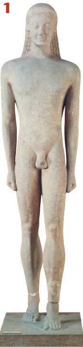
«Ο κούρος της Μήλου» (ΕΙΚ. 1).