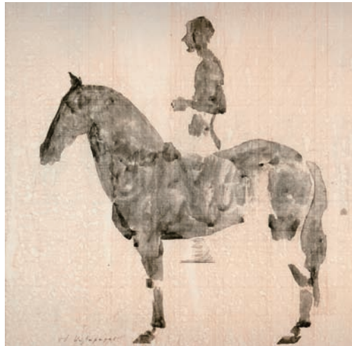
Σχέδια με άλογα και αναβάτες του Ιταλού γλύπτη Μαρίνο Μαρίνι (εικ. 1,2).

Ο Καλαμάρας και ο Μαρίνι ασχολήθηκαν με τη μελέτη του αλόγου και μεγάλο μέρος της δημιουργίας τους με σχέδια και γλυπτά είναι αφιερωμένο σ' αυτό.