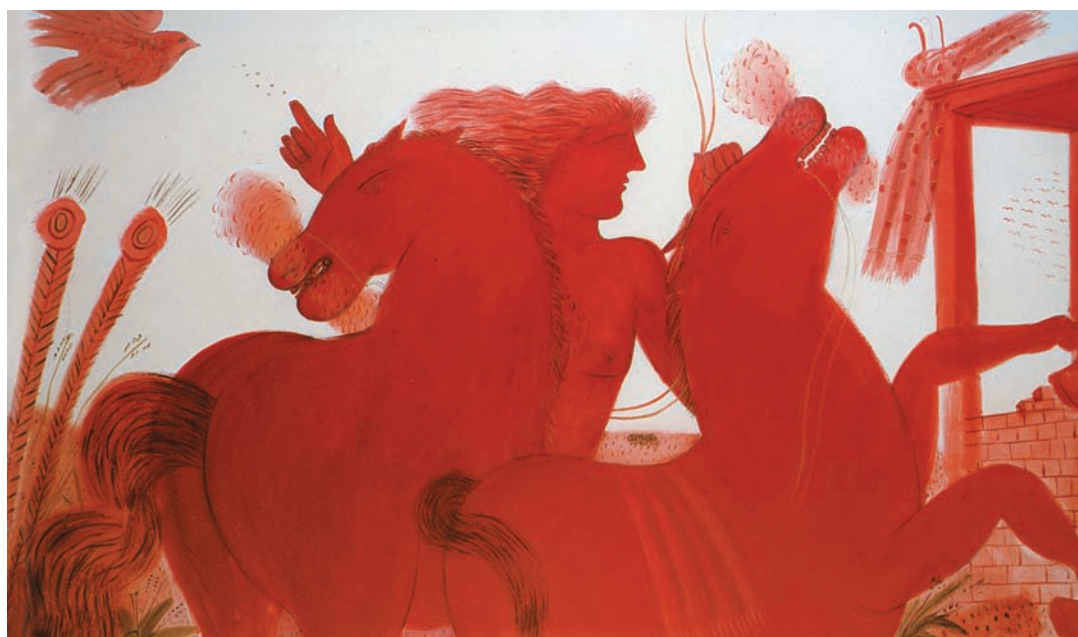
Αλέκος Φασσιανός «Έφηβος με άλογα» (εικ. 2).

Ο Αλέκος Φασσιανός είναι ένας σύγχρονος δημιουργός. Ένα μέρος της δουλειάς του είναι αφιερωμένο στ' άλογα και τα ζωγραφίζει με έντονα χρώματα και με μεγάλα σχήματα.