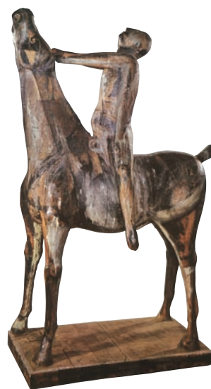
«Άλογο και αναβάτης» σε χρωματισμένο ξύλο του Μαρίνο Μαρίνι (εικ. 6).