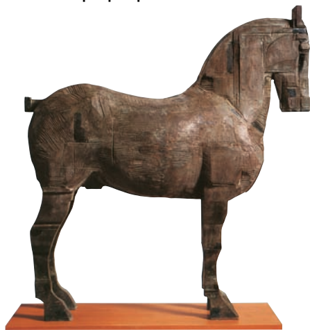
«Άλογο» σε μπρούντζο του Δημήτρη Καλαμάρα (εικ. 5)