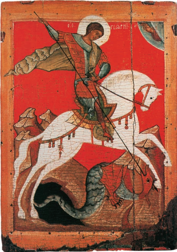
Ο Άγιος Γεώργιος Ρωσική αγιογραφία του 14ου αιώνα (εικ.1).