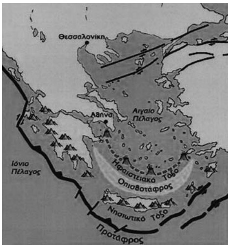
Εικόνα 26.4: Το Ελληνικό τόξο (Παπανικολάου Δ., 1998)

Το τόξο που δημιουργείται στην περίπτωση αυτή αποτελείται από την ελληνική τάφρο , το νησιωτικό τόξο, την οπισθοτάφρο και το νηφαιστειακό τόξο .