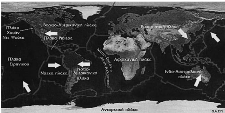
Εικόνα 26.1: Λιθοσφαιρικές πλάκες