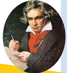
Λούντβιχ βαν Μπετόβεν