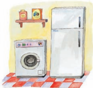
Ψυγείο και πλυντήριο.