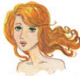
Η Αθηνά είδε στο περιοδικό μία ωραία ηθοποιό.