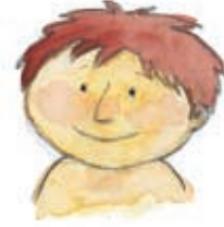
Το μωρό χαμογελάει συνέχεια.