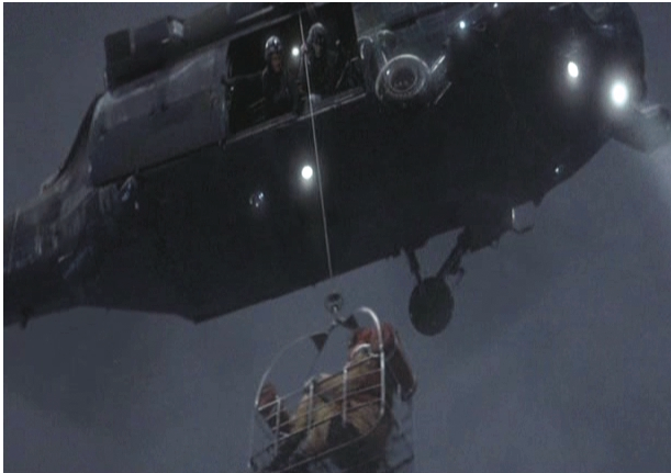
Ελικόπτερο διάσωσης ανασύρει ναυαγό από τη θάλασσα (στιγμιότυπο από την ταινία "Η Καταιγίδα" της εταιρείας Warner Bros Entertainment U.K. Limited).

Ο χριστιανός δεν πρέπει να χάνει την ελπίδα, το θάρρος και την πίστη του μπροστά στις δυσκολίες. Με τη βοήθεια του Θεού συνεχίζει τον αγώνα του με χαρούμενη διάθεση.