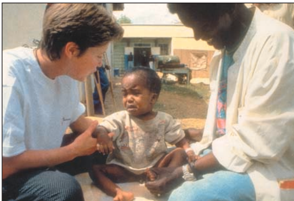
Περιμένουν τη βοήθειά μας...

Άλλωστε, ο Απόστολος Παύλος, υμνώντας την αγάπη, μας διδάσκει ότι ακόμη και εάν πετύχουμε τα σπουδαιότερα κατορθώματα, εάν δεν έχουμε αγάπη για το διπλανό μας τότε τίποτα από όλα αυτά δεν έχει αξία. Η αγάπη μαζί με την πίστη, την ελπίδα και την υπομονή δίνουν στον αγώνα μας μοναδική αξία!