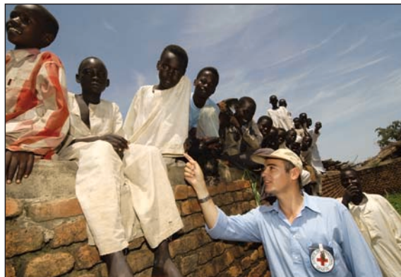
...για να μπορούν να γελούν συχνότερα!