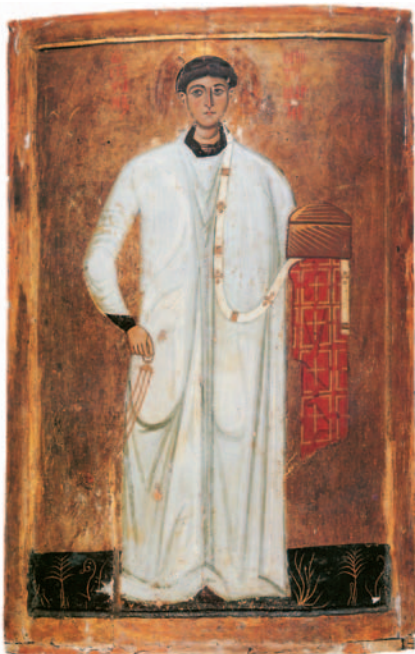
Ο πρωτομάρτυρας Στέφανος υπηρέτησε την Εκκλησία κι έδωσε πρώτος τη ζωή του για το Χριστό (εικόνα από την Ι.Μ. Αγ. Αικατερίνης, Σινά).

Για να γίνει λοιπόν πιο εύκολο το έργο της Εκκλησίας, οι Απόστολοι ζήτησαν από τα μέλη της να εκλέξουν επτά διακόνους, τους πιο πρόθυμους, εργατικούς και αφοσιωμένους, ώστε να τους αναθέσει τη φροντίδα των πονεμένων. Ανάμεσά τους ήταν κι ο Στέφανος, ο οποίος δέχτηκε με χαρά την αποστολή του και πρωταγωνίστησε στα καθήκοντα που ανέλαβε. Φρόντιζε και περιποιόταν τους φτωχούς και τους πεινασμένους και τους μιλούσε για τον καινούργιο κόσμο που ο Χριστός είχε υποσχεθεί.