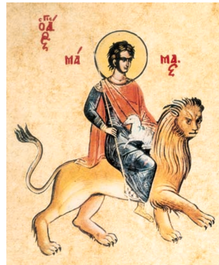
Ο Άγιος Μάμας (2 Σεπτεμβρίου) είναι ο προστάτης των ζώων (εικόνα από το βιβλίο του Π. Μ. Σωτήρχου, Παιδομάρτυρες. Παιδιά που μαρτύρησαν και θυσιάστηκαν για τον Χριστό ).

Ο Μάμας μεγάλωσε με ζήλο και ευλάβεια, χωρίς ποτέ να κρύβει την πίστη του. Ήταν δεκαπέντε ετών, όταν ο ηγεμόνας της περιοχής έμαθε γι' αυτόν και τον κάλεσε σε απολογία. Ο Μάμας αρνήθηκε να θυσιάσει στα είδωλα και έδειξε στον ηγεμόνα ότι δεν φοβόταν τα βασανιστήρια. Όλοι θαύμασαν το θάρρος και τη δύναμή του. Ωστόσο, αποφάσισαν να τον θανατώσουν. Καθώς τον βασάνιζαν σκληρά, ξαφνικά χάθηκε από μπροστά τους! Ο Θεός με θαυμαστό τρόπο τον είχε οδηγήσει στα βουνά της Καισάρειας, όπου έζησε για λίγο σε μία σπηλιά, πίνοντας γάλα από μια ελαφίνα που ερχόταν κοντά του. Επειδή μάλιστα τα ζώα τον αγαπούσαν πολύ, ο άγιος Μάμας θεωρείται και ο προστάτης τους.