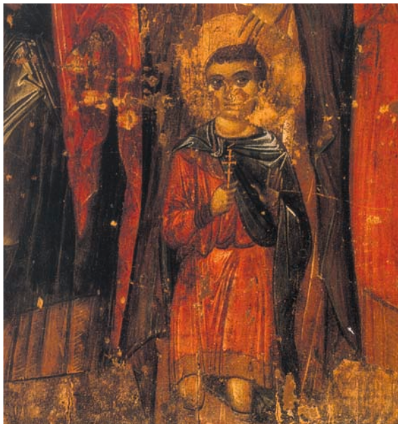
Πλήθος παιδιών-μαρτύρων προτίμησαν το θάνατο, από το να προδώσουν την πίστη τους στο Χριστό (εικόνα που εκτίθεται στο Βυζαντινό Μουσείο Αθηνών).

Ο μικρός Κυριακός παρακολουθούσε όσα συνέβαιναν. Ο Μάξιμος, νομίζοντας ότι είχε φοβηθεί, τον ρώτησε με πονηρό τρόπο: «Ποιος νομίζεις ότι είναι ο μεγαλύτερος και σπουδαιότερος Θεός, ο Δίας ή ο Χριστός;» Το νήπιο, χωρίς να φοβηθεί και έχοντας την ξεχωριστή σοφία που δίνει ο Θεός σε όσους τον αγαπούν απάντησε: «Μα φυσικά ο Χριστός!». Τότε εξοργισμένος ο ηγεμόνας διέταξε να τον σκοτώσουν. Ο μικρός Κυριακός, με τη γενναιότητα και την παιδική του αθωότητα, είχε κατακτήσει το αμάραντο στεφάνι του μαρτυρίου. Η μνήμη του γιορτάζεται στις 24 Μαΐου.