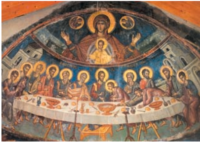
Η Πλατυτέρα και ο Μυστικός Δείπνος (Παρεκκλήσιο Ιω. Προδρόμου, Ι. Μ. Σταυρονικήτα, Άγ. Όρος).

των ουρανών". Καθισμένη σε θρόνο, με τον Ιησού βρέφος στην αγκαλιά της, είναι η "γέφυρα" όπως λέμε, που συνδέει τα μέλη της Εκκλησίας με το Θεό. Κάτω από την Πλατυτέρα εικονίζεται η Θεία Κοινωνία των Αποστόλων από τον ίδιο το Χριστό. Κοινά του βρίσκονται οι μεγάλοι ιεράρχες που έχουν γράψει τις λειτουργίες της Εκκλησίας μας, ο Μ. Βασίλειος και ο Ιωάννης ο Χρυσόστομος, οι οποίοι λειτουργούν μαζί του. Αυτός είναι ο λειτουργικός κύκλος παιδιά».