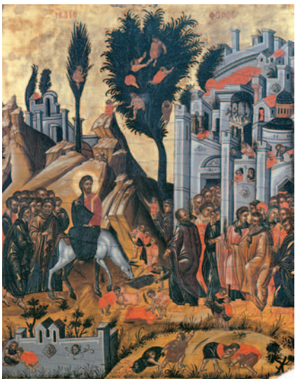
Και η «Βαϊοφόρος» είναι μία από τις παραστάσεις του ιστορικού κύκλου (Ι. Μ. Διονυσίου, Άγ. Όρος).

«Και ο ιστορικός κύκλος παππούλη;» ρώτησε η Βασιλική. «Τον ονομάζουμε έτσι, γιατί περιγράφει σκηνές από τη ζωή του Χριστού, της Θεοτόκου και των αγίων. Σε αυτόν εξιστορούνται όλα τα μεγάλα γεγονότα, όπως η Γέννηση, η Βάπτισμα, η Σταύρωση, η Ανάσταση, τα θαύματα, οι παραβολές, η Γέννηση της Θεοτόκου, ο Ευαγγελισμός, η Κοίμησή της, καθώς και παραστάσεις μαρτύρων και οσίων της Εκκλησίας μας».