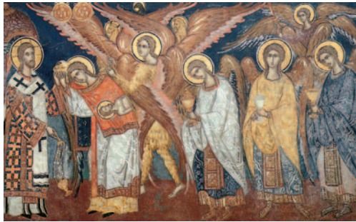
«Η λειτουργία των αγγέλων», με Αρχιερέα τον Χριστό. Παράσταση που συναντούμε κάτω από την Πλατυτέρα (τοιχογραφία από την Ι. Μ. Φιλανθρωπινών στο νησί της λίμνης των Ιωαννίνων).

Και ο παππούλης συνέχισε: «Λίγο πιο κάτω, εκεί που ενώνεται το δάπεδο (γη), με τον τρούλο (ουρανό), βρίσκεται η κόγχη, όπου η Παναγία εικονίζεται ως η "Πλατυτέρα