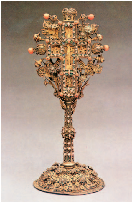
Σταυρός Αγιασμού, χρυσό με σμάλτο και κοράλλια (Ι.Μ. Μεγάλου Μετεώρου, 1795).

ραστάσεις και σχέδια επάνω σε σκεύη που χρησιμοποιούνται στη λατρεία του Θεού. Η χρυσοκεντητική είναι η τέχνη που χρησιμοποιούμε για να στολίζουμε τα άμφια των ιερέων ή διάφορα καλύμματα (π.χ. της Αγίας Τράπεζας), κεντώντας πάνω σ' αυτά παραστάσεις και μορφές με χρυσές και ασημένιες κλωστές. Η ξυλογλυπτική είναι η τέχνη του σκαλίσματος του ξύλου με το οποίο κατασκευάζονται τα τέμπλα, τα στασίδια και τα αναλόγια, με παραστάσεις από την Παλαιά και Καινή Διαθήκη ή με συμβολικές παραστάσεις από ζώα και φυτά. Τα πιο βαριά και ογκώδη αντικείμενα, όπως οι πολυέλαιοι, οι καμπάνες, οι πόρτες και τα μανουάλια κατασκευάζονται από ορείχαλκο και είναι συνήθως χυτά .