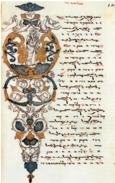
Μικρογραφημένο φύλλο χάρτινου κώδικα με οίκους της Θεοτόκου (Ι. Μ. Βατοπαιδίου, Άγ. Όρος).