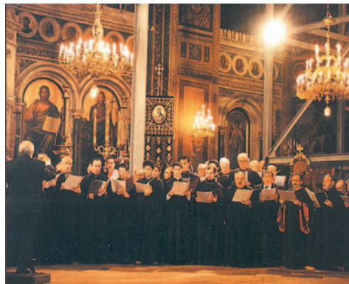
Στη διάρκεια κάθε ακολουθίας, ο «χορός» των ψαλτών αποδίδει τους ύμνους και τους ψαλμούς, δημιουργώντας κατανυκτική ατμόσφαιρα.

Πολλοί μεγάλοι μουσικοί μελοποίησαν τα τροπάρια της Εκκλησίας σ' αυτούς τους οκτώ ήχους και μας έδωσαν υπέροχες μελωδίες. Σημαντικότεροι μελουργοί είναι: ο Ιωάννης Κουκουζέλης, ο Πέτρος Πελοποννήσιος, ο ιερέας Μπαλάσιος, ο Πέτρος Μπερεκέτης και πολλοί άλλοι.