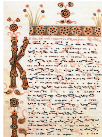
Χειρόγραφο με τη θεωρία της βυζαντινής μουσικής (Ι.Μ. Παντοκράτορος, Άγιον Όρος, 15ος αι.).

Ο Ρωμανός θεωρείται ως ο μεγαλύτερος ποιητής της βυζαντινής περιόδου. Έγραψε περίπου 1.000 κοντάκια , αλλά έχουν σωθεί μόνο τα 335. Το εξαιρετικό έργο του αναγνωρίστηκε γρήγορα και ο Ρωμανός βρέθηκε να υπηρετεί σε σημαντική θέση μέσα στην Εκκλησία της Κωνσταντινούπολης. Αργότερα, έγινε αυλικός ποιητής του Ιουστινιανού και τιμήθηκε με τον τίτλο του «Κυρίου», ο οποίος απονεμόταν μόνο σε μεγάλης αξίας εκκλησιαστικά πρόσωπα. Τα κείμενα και οι ύμνοι του στολίζουν με το περιεχόμενο και τη μελωδία τους πολλά λειτουργικά βιβλία της Εκκλησίας μας.