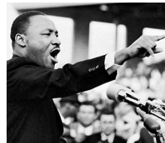
Μάρτιν Λούθερ Κινγκ: Ένας αγωνιστής για τα δικαιώματα όλων των ανθρώπων.

«Οι άνθρωποι», συνέχισε ο δάσκαλος, «πολλές φορές στην ιστορία πήραν μέρος σε αγώνες για τη δικαιοσύνη. Ένας από αυτούς, ο Μάρτιν Λούθερ Κινγκ, σπουδαίος άνθρωπος και γενναίος αγωνιστής, πρόσφερε τον εαυτό του πριν από πολλά χρόνια στον αγώνα για την ισότητα και τη δικαιοσύνη ανάμεσα στους ανθρώπους. Ο ίδιος ήταν μαύρος κι ένιωθε βαθιά μέσα του την αδικία και τις διακρίσεις εναντίον όσων είχαν άλλο χρώμα, όπως αυτός. Ο αγώνας του ήταν τόσο σκληρός, ώστε τελικά θυσιάστηκε για τις ιδέες του. Ωστόσο, το κήρυγμά του έμεινε ζωντανό, και τελικά έγινε πραγματικότητα! Αυτό που κράτησε το κήρυγμά του ζωντανό ήταν η φλόγα της αγάπης για τον συνάνθρωπο, όσο διαφορετικός και αν είναι. Έλεγε ότι ο άνθρωπος δεν πρέπει να κρίνεται από το χρώμα του αλλά από τον χαρακτήρα του και ονειρευόταν τη μέρα που μικρά μαύρα αγόρια και κορίτσια θα κρατούσαν από το χέρι μικρά λευκά αγόρια και κορίτσια σαν αδέρφια τους».