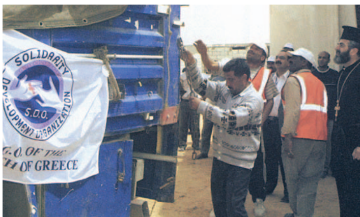
Αποστολή ανθρωπιστικής βοήθειας από την Εκκλησία της Ελλάδος.

Εάν κι εμείς θέλουμε πραγματικά να βοηθήσουμε, πρέπει πρώτα να κάνουμε πράξη αυτή τη διδασκαλία. Έπειτα, να πιέσουμε με κάθε τρόπο, ώστε οι κυβερνήσεις να αντιμετωπίσουν τις ανάγκες των πεινασμένων, πριν είναι αργά. Αν και αρκετοί λαοί ήδη έχουν κινητοποιηθεί, αυτές οι προσπάθειες πρέπει να συνεχιστούν από τις πλούσιες χώρες, ώστε οι πεινασμένοι αδελφοί μας να σωθούν από την τραγική αυτή κατάσταση. Γι' αυτό, η παγκόσμια κοινότητα θα πρέπει να αντιδράσει σύντομα, αλλιώς το αποτέλεσμα θα είναι μια τεράστια ανθρωπιστική καταστροφή χωρίς προηγούμενο».