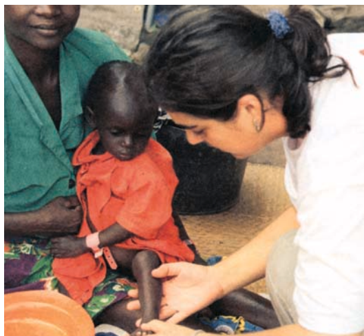
... η ελπίδα όμως εξακολουθεί να ζει στις καρδιές τους!