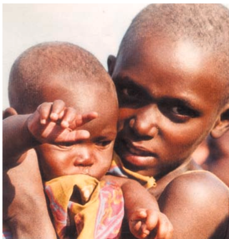
Χιλιάδες παιδιά πεθαίνουν από πείνα στον Νίγηρα, τη δεύτερη φτωχότερη χώρα στον κόσμο...

(Δημοσίευμα της οργάνωσης «Γιατροί χωρίς σύνορα» με αφορμή τη Διεθνή Ημέρα για τους «Πληθυσμούς σε κίνδυνο» το 1996)