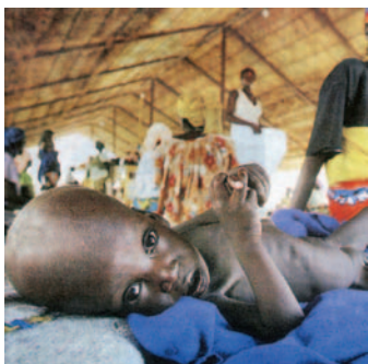
Κάθε χρόνο πεθαίνουν 6 εκατομμύρια παιδιά από την πείνα.