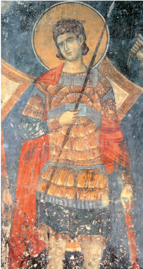
Ο Άγιος Νέστορας, με πίστη στο Θεό και με την ευλογία του Αγίου Δημητρίου, έριξε νεκρό το γιγαντόσωμο Λυαίο (Καθολικό Ι. Μ. Παναγίας της Ολυμπιώτισσας, Ελασσόνα).