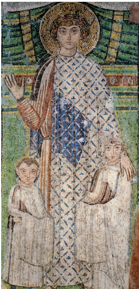
Ο Αγ. Δημήτριος προστατεύει τα παιδιά και παρακαλεί γι' αυτά τον Θεό (ψηφιδωτό 7ου αι., Αγ. Δημήτριος, Θεσσαλονίκη).