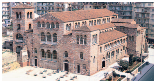
Ο ιερός ναός του Αγίου Δημητρίου, πολιούχου της πόλης της Θεσσαλονίκης.

Στη Θεσσαλονίκη, από τον 12 ο αιώνα μ.Χ, διοργανωνόταν από τους βυζαντινούς ετήσια εμποροπανήγυρη, ώστε να τιμηθεί με λαμπρότητα η μνήμη του Αγίου Δημητρίου. Από τον 14 ο αιώνα και μετά, οι εκδηλώσεις αυτές πήραν μια πιο γιορτινή μορφή. Πλήθη εμπόρων από το Βυζάντιο και ολόκληρη την Ευρώπη συμμετείχαν. Μετά την ανακήρυξη του Αγίου Δημητρίου σε πολιούχο της πόλης, οι εκδηλώσεις αυτές μετονομάστηκαν σε «Δημήτρια» προς τιμήν του. Από το 1995, τα «Δημήτρια» θεωρούνται ως ένα από τα σημαντικότερα πολιτιστικά γεγονότα σε πανευρωπαϊκό επίπεδο. Επιστημονικά συνέδρια, συναυλίες βυζαντινής, παραδοσιακής και συμφωνικής μουσικής, θέατρο και δημοτικοί χοροί, πλουτίζουν την ξεχωριστή αυτή γιορτή, δίνοντας ιδιαίτερη λάμψη στην πόλη της Θεσσαλονίκης, τιμώντας και με αυτό τον τρόπο τον πολιούχο και προστάτη της, Άγιο Δημήτριο.