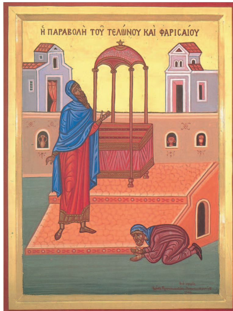
Εικ. 14 η : Η προσευχή του Τελώνη και του Φαρισαίου.