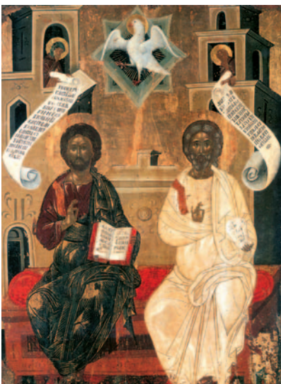
Εικ. 32 η : Η Αγία Τριάς, 15ος αι.μ.Χ., Μουσείο Μπενάκη, Αθήνα.