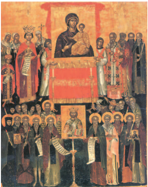
Εικ. 31 η : Η αναστήλωση των εικόνων. Φορητή εικόνα, μέσα 16ου αι.μ.Χ., Μουσείο Μπενάκη, Αθήνα.

4. Αφού χωριστείτε σε ομάδες μπορείτε να επισκεφθείτε ένα ναό της ενορίας σας και στη συνέχεια να συγκεντρώσετε υλικό για τα τέσσερα είδη της χριστιανικής αγιογραφίας: α) τις φορητές εικόνες, β) τις τοιχογραφίες, γ) τα μωσαϊκά ή ψηφιδωτά και δ) τις μικρογραφίες (διακοσμητικές συνθέσεις, παραστάσεις σε χειρόγραφα) κ.ά. Παρουσιάστε τα αποτελέσματα των εργασιών σας στην τάξη.