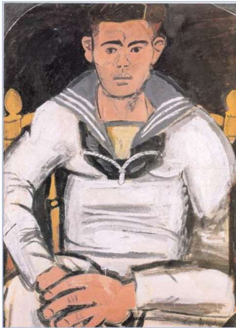
Γιάννης Τσαρούχης, Ναύτης