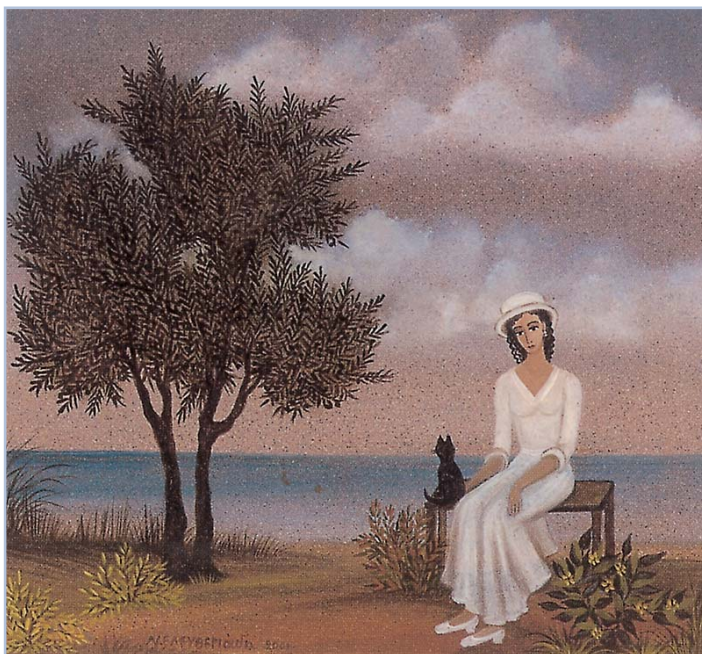
Νίκη Ελευθεριάδη, Γυναίκα και γάτα