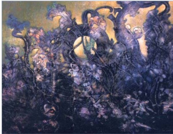
Μαξ Ερνστ, Το τελευταίο δάσος

Ε. Έσε, Η πόλη των ξένων στο νότο , μτφρ. Θ. Λουπασάκης, Σμίλη