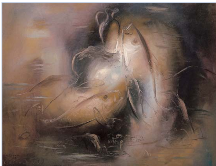
Γιώργος Γουναρόπουλος, Ψάρι και κανάτι σε θαλασσινό τοπίο