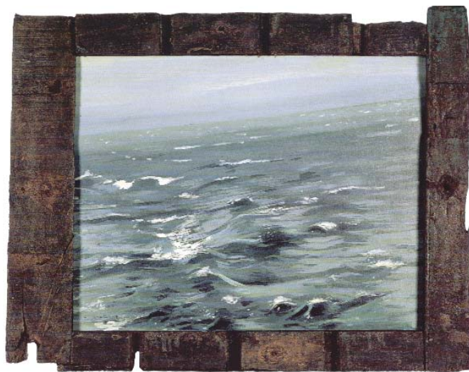
Κώστας Τσόκλης, Θαλασσινό τοπίο

Το ποίημα γράφτηκε το 1940 και περιστρέφεται γύρω από τις πιο χαρακτηριστικές εικόνες του ελληνικού και μεσογειακού τοπίου: θάλασσα, ουρανό και ήλιο. Η κυρίαρχη αυτή αίσθηση της φύσης ζωντανεύει μπροστά στα μάτια μας και τονώνει τη συναισθηματική μας διάθεση.