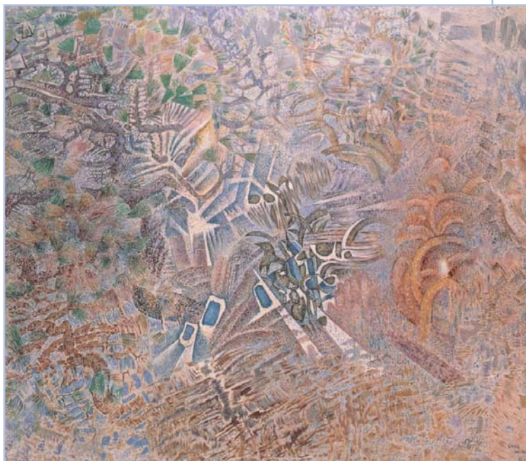
Νίκος Χατζηκυριάκος-Γιάκας, Ο ουρανός

νες περιοχές που μας τάξατε. Εκεί θα ζήσουμε, μπορεί, τις μετροημένες μέρες μας καταπώς το θελήσαμε. Όταν ο στερνός ερυθρόδεσμος λείπει από τη γη, και από τη μνήμη δεν απομείνει παρά ο ίσκιος από ένα σύννεφο που ταξιδεύει στον κάμπο, οι ακρογιαλιές αυτές και τα δάση θα φυλάγουν ακόμα τα πνεύματα του λαού μου – τι* αυτή τη γη την αγαπούν, όπως το βρέφος αγαπάει το χτύπο της μητρικής καρδιάς. Αν σας την πουλήσουμε τη γη μας, αγαπήστε την, καθώς την αγαπήσαμε εμείς, φροντίστε την, καθώς τη φροντίσαμε εμείς, κρατήστε ζωντανή στο λογισμό σας τη μνήμη της γης, όπως βρίσκεται τη στιγμή που την παίρνετε, και με όλη σας τη δύναμη, με όλη την τρανή μπόρεσή σας, με όλη την καρδιά σας, διατηρήστε τη για τα τέκνα σας, και αγαπήστε την, καθώς ο Θεός αγαπάει όλους μας. Ένα ξέρομε – ο Θεός σας είναι ο ίδιος Θεός. Η γη Του είναι ακριβή. Ακόμα και ο λευκός δε γίνεται να απαλλαχτεί από την κοινή μοίρα.*