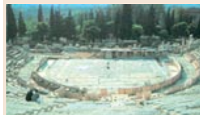
Το θέατρο του Διονύσου

Από την τριλογία του Ευριπίδη, που παρουσιάστηκε στα Διονύσια την άνοιξη του 412 π.Χ., μόνο η Ελένη σώθηκε. Πώς να κρίθηκε άραγε;