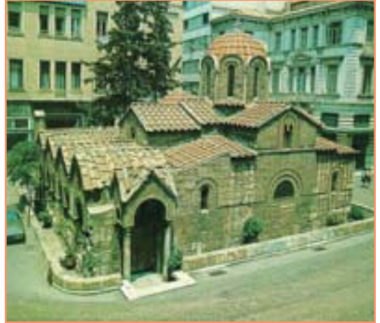
Καπνικαρέα, ένα μνημείο στο κέντρο της αγοράς, Διεύθυνση Βυζαντινών και Μεταβυζαντινών Μνημείων, Ενημερωτικό φυλλάδιο Υπουργείου Πολιτισμού

Η Καπνικαρέα, σύμβολο μιας άλλης εποχής στην καρδιά της πόλης, τόπος συνάντησης και ξεκούρασης για τους περαστικούς, χώρος συγκέντρωσης και προσευχής για τους πιστούς, σημείο προσέλευσης επισκεπτών, μάρτυρας της ανάπτυξης και των αλλαγών της μεγαλούπολης, αγαπημένη εκκλησία παλαιότερων και νεότερων, αδιάφορη για άλλους, είναι εκεί, στο κέντρο, μέσα στον περίπατό σου, για να αναπτύξεις τη δική σου σχέση μαζί της.