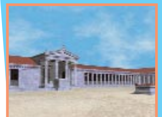
Γενική άποψη της δυτικής πτέρυγας της βόρειας αγοράς της Μιλήτου