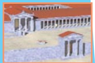
Γενική άποψη της βόρειας αγοράς της Μιλήτου