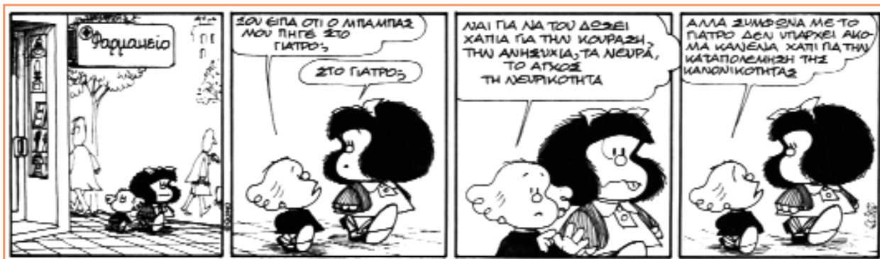
Quino, Μαφάλντα, αρ. 12, μτφρ. Κατερίνα Χριστοδούλου, εκδ. Ars Longa, 1989