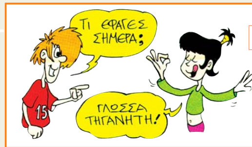
Περ. «Ερευνητές», εφημ. Η ΚΑΘΗΜΕΡΙΝΗ, 2002