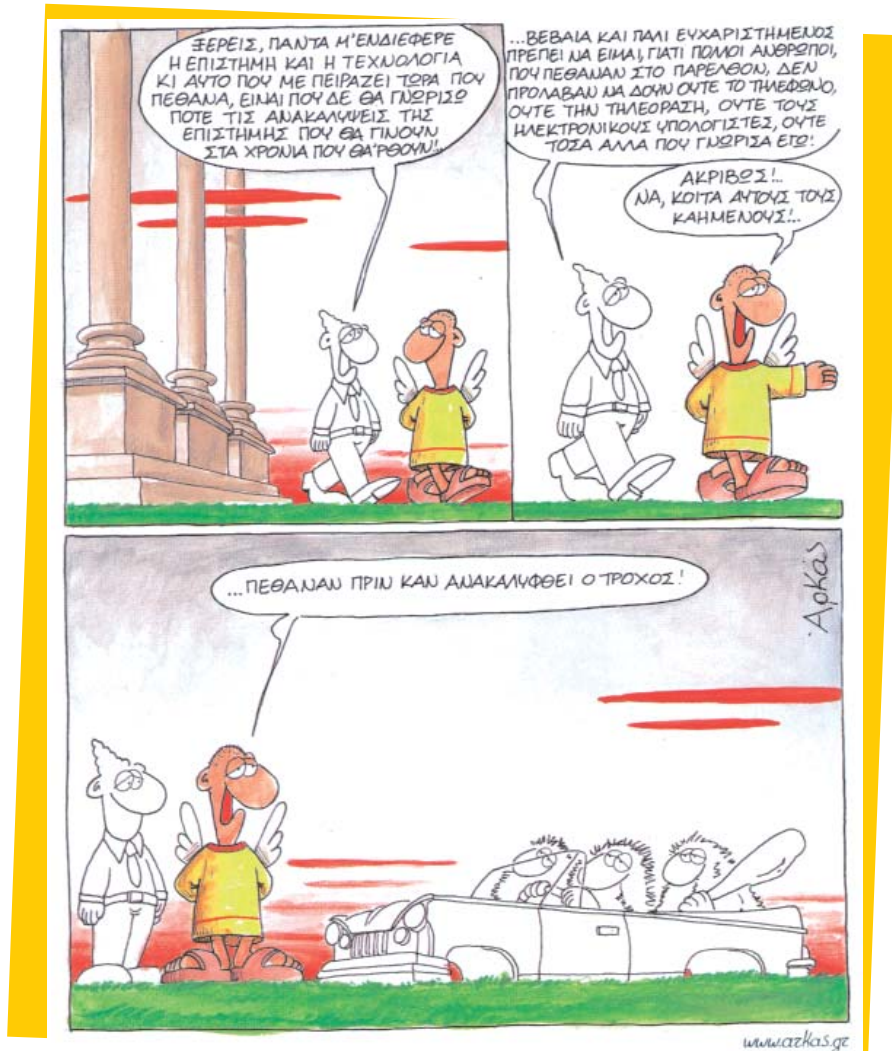
Η ζωή μετά του Αρκά, περ. «Εψιλον», εφημ. ΕΛΕΥΘΕΡΟΤΥΠΙΑ, 2004