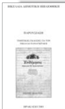
Τιμητική έκδοση για το Νικόλαο Παναγιωτάκη