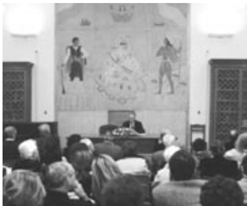
Αίθουσα «Δομήνικος Θεοτοκόπουλος» της Βικελαίας Δημοτικής Βιβλιοθήκης

Σ ε κάθε τοπική κοινωνία λειτουργούν ποικίλες συσσωματώσεις πολιτών, που με την καθημερινή δραστηριότητά τους προσδίδουν στο κοινωνικό σύνολο ιδιαίτερα χαρακτηριστικά, τα οποία το καθιστούν μοναδικό ως προς την ταυτότητά του. Στη χώ-