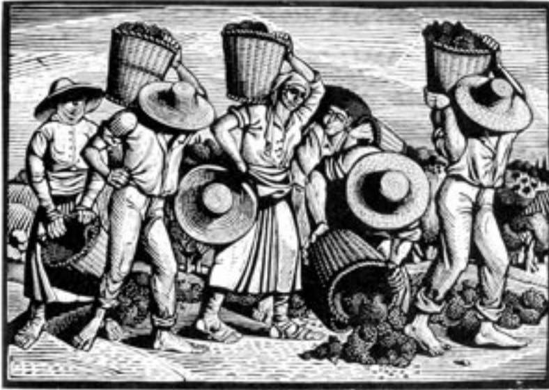
Α. Τάσος, Τρύγος, Ξυλογραφία του 1953

Ο ι δείκτες της κινητικότητας του αγροτικού πληθυσμού επηρεάζονται από ποικιλία παραγόντων, ιδιαίτερα από τον οικονομικό, ο οποίος διαμορφώνεται από πλήθος παραμέτρων, όπως το μέγεθος και οι παραγωγικές δυνατότητες του αγροτικού κλήρου, τα διαθέσιμα κεφάλαια, η προσβασιμότητα στην αγορά, η προσφορά και η ζήτηση της παραγωγής, η εφαρμοζόμενη φορολογική και πιστωτική πολιτική και άλλες συναφείς.