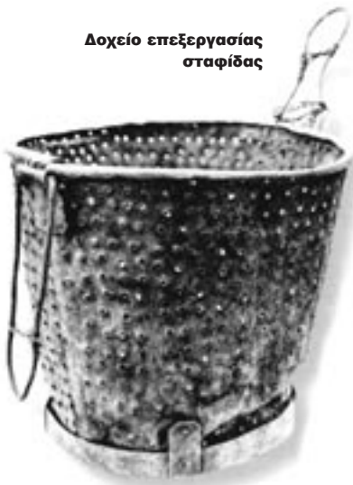
Δοχείο επεξεργασίας σταφίδας