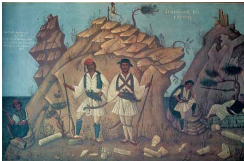
Φ. Κόντογλου, «Αρματολοί και κλέφτες» (Έλληνες ζωγράφοι, εκδ. Μέλισσα)

Με βάση τη μορφή τους ο Νικόλαος Πολίτης κατέταξε τα δημοτικά τραγούδια σε δύο μεγάλες κατηγορίες: α) τα καθαρώς λυρικά ή τραγούδια , εκείνα δηλαδή που τον πυρήνα, την ουσία τους δηλαδή, αποτελεί η έκφραση του συναισθήματος (χαρά, λύπη, αγάπη, μίσος, θαυμασμός) και β) τα επικολυρικά ή διηγηματικά , εκείνα δηλαδή που κύριο σκοπό τους έχουν να μας διηγηθούν, με τρόπο ποιητικό, μια παράδοση, μια ιστορία, ένα μύθο. Πυρήνας δηλαδή των τραγουδιών της κατηγορίας αυτής είναι η διήγηση. Τα διηγηματικά αυτά τραγούδια χωρίζονται σε τρεις κατηγορίες: σε όσα αναφέρονται γενικά στη δημόσια ζωή ( ακριτικά, κλέφτικα, θρήνοι για την άλωση πόλεων κ.λπ. ), σε όσα αναφέρονται σε εκδηλώσεις και συνήθειες της ιδιωτικής ζωής ( της ξενιτειάς, μοιρολόγια, νανουρίσματα, της αγάπης κ.λπ. ) και τέλος στις παραλογές.