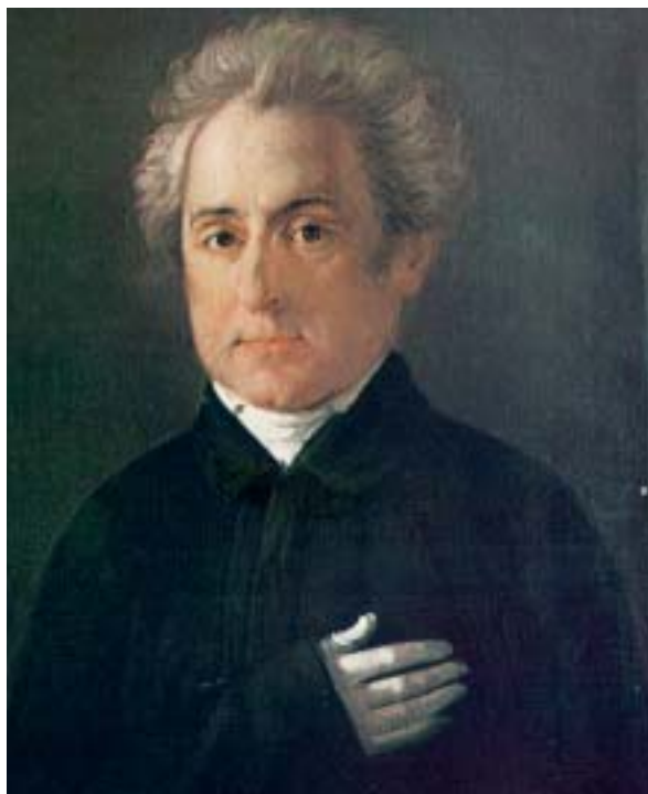
Προσωπογραφία Δ. Σολωμού (Ανθολογία Σοκόλη)

τις θυσίες των Ελλήνων στη διάρκεια του απελευθερωτικού αγώνα. Η ποίηση του Σολωμού επικεντρώθηκε στα μεγάλα θέματα που απασχόλησαν φιλοσόφους και ποιητές μέσα στους αιώνες: ελευθερία, φύση, θρησκεία, θάνατος και έρωτας. Στα ποιήματά του η ελευθερία θριαμβεύει ενάντια στη φύση και η θρησκεία ενάντια στο θάνατο. Στην ποίησή του συνδέονται ο θάνατος με τον έρωτα, ο οποίος στη σολωμική ποίηση είναι πάντα αγνός. Ο Σολωμός ήταν ο πρώτος που ανέδειξε τη δημοτική γλώσσα ως μοναδική για την έμμετρη δημιουργία.