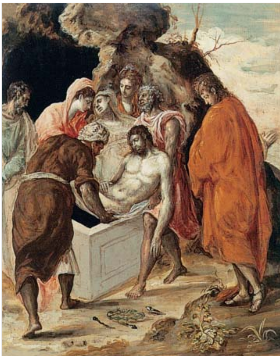
Δομίνικος Θεοτοκόπουλος (1541-1614), «Η ταφή του Χριστού» (Εθνική Πινακοθήκη)