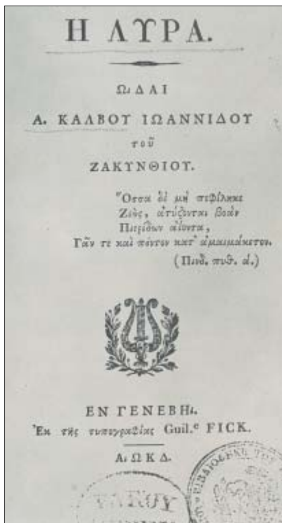
Οι Ωδές του Κάλβου

Έλληνας της διασποράς ο Κάλβος διαμορφώθηκε στο εξωτερικό και αφομοίωσε τα πιο ανόμοια στοιχεία. Επηρεασμένος από τον κλασικισμό του Φώσκολο συνδυάζει στο έργο του την αρχαιοπρέπεια με το ρομαντισμό. Η ιδιοτυπία της γλώσσας