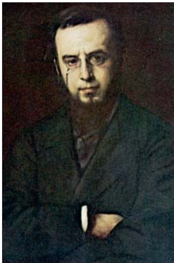
Δ. Βικέλας

ότι ο ηρωισμός δεν είναι μόνο ηρωικές πράξεις, αλλά και σύνεση και προνοητικότητα. Χωρίς να παραποιεί όσα του εμπιστεύτηκε ο πληροφοριοδότης του, ο Βικέλας εγκαταλείπει τη ρητορεία του ηρωισμού και αναδεικνύει τα καθημερινά προβλήματα του ανθρώπου που προσπαθεί με κάθε τρόπο να σωθεί. Το έργο θεωρήθηκε ανανεωτικό, γιατί προαναγγέλλει το ρεαλισμό. Ο Βικέλας, άνθρωπος μετριοπαθής, ήταν ο ίδιος επιχειρηματίας με σημαντική κοινωνική επιφάνεια, χάρη στην οποία έπεισε την Ολυμπιακή Επιτροπή να γίνουν στην Αθήνα οι αγώνες του 1896.