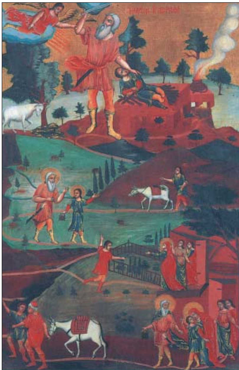
«Η Θυσία του Αβραάμ» («Κειμήλια προσφύγων από τη Μικρά Ασία»), 19ος αιώνας (Βυζαντινό Μουσείο Αθηνών)

την Καινή Διαθήκη. Υπόθεση του έργου είναι το γνωστό επεισόδιο της Παλαιάς Διαθήκης, όπως αναφέρεται στο 24ο κεφάλαιο της Γενέσεως .