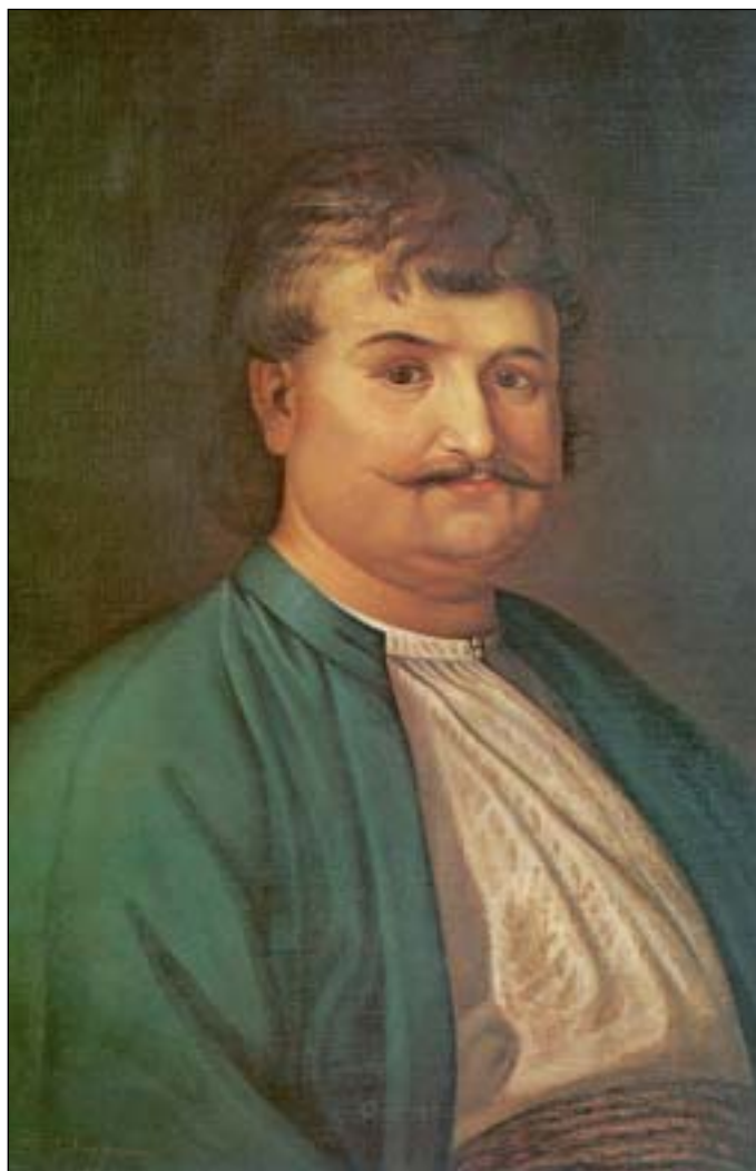
Προσωπογραφία Ρήγα Φεραίου (Ανθολογία Σοκόλη)

1844) και Δανιήλ Φιλιππίδης (1755-1832) που έγραψαν τη Γεωγραφία Νεοτερική (1791), από τα σημαντικότερα μνημεία του Νεοελληνικού Διαφωτισμού. Μαθητής του Καταρτζή ήταν επίσης και ο Ρήγας Φεραίος (1758-1798) από το Βελεστίνο, ένα μικρό χωριό της Θεσσαλίας (ο ίδιος ονομάζεται πάντα Βελεστινλής, το Φεραίος είναι μεταγενέστερος εξαρχαισμός). Ο Ρήγας αφού έλαβε την εγκύκλια μόρφωση στην ιδιαίτερη πατρίδα του, έγινε γραμματικός αρχικά του Υψηλάντη, στην Κωνσταντι-