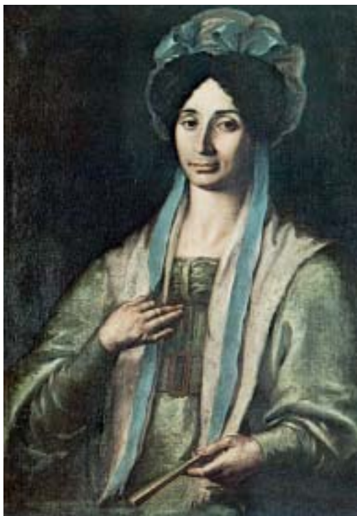
Φωτογραφία της Μαρτινέγκου, Αθήνα, Εθνική Πινακοθήκη (Ιστορία του Ελληνικού Έθνους)

Η Μαρτινέγκου θέλησε επίσημα να συμμετάσχει στον αγώνα για την ελευθερία που πληροφορήθηκε πως είχε αρχίσει στην Ελλάδα, αλλά μια τέτοια συμμετοχή αποκλειόταν από το «βάρβαρον ήθος της Ζακύνθου, οπού κρατάταις κοπέλλαις κλεισμέναις» και από το γεγονός ότι «είναι γυναίκα και περιπλέον γυναίκα Ζακυνθία». Έτσι το μόνο που έκανε ήταν να «παρακαλέσει τον Ουρανόν δια να ήθελε τους βοηθήσει να νικήσουν», ώστε να αξιωθεί και η ίδια «να ιδή εις την Ελλάδα επιστρεμμένην την ελευθερίαν και μαζί με αυτήν επιστραμμένης εις τας καθέδρας τους τας σεμνάς μούσας...» .