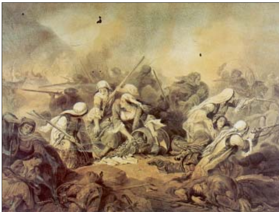
Deneuville: «Οι Σουλιώτισσες πολεμούν» (Συλλογή Τάσσου Χατζή, Ανθολογία Σοκόλη)

Οι πολιτικοί που ήθελαν να γράψουν τα απομνημονεύματά τους δεν συναντούσαν δυσκολίες. Όσοι όμως οπλαρχηγοί και στρατιωτικοί δεν ήταν εξοικειωμένοι με το γράψιμο, δυσκολεύονταν και πολλές φορές χρησιμοποιούσαν έναν «γραμματικό». Το χρονικό της σκλαβωμένης Αθήνας του Παναγή Σκουζέ (1776-1847) αποκαλύφτηκε επίσης από το Γεώργιο Τερτσέτη στα 1859. Εδώ εξιστορείται σε αυθεντική λαϊκή γλώσσα η περίοδος από το 1772 ως το 1796.