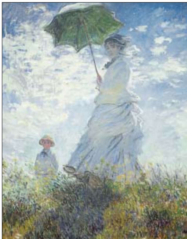
Κλοντ Μονέ, «Γυναίκα με ομπρέλα», 1875 (Ο κόσμος της ζωγραφικής, εκδ. Πατάκη)