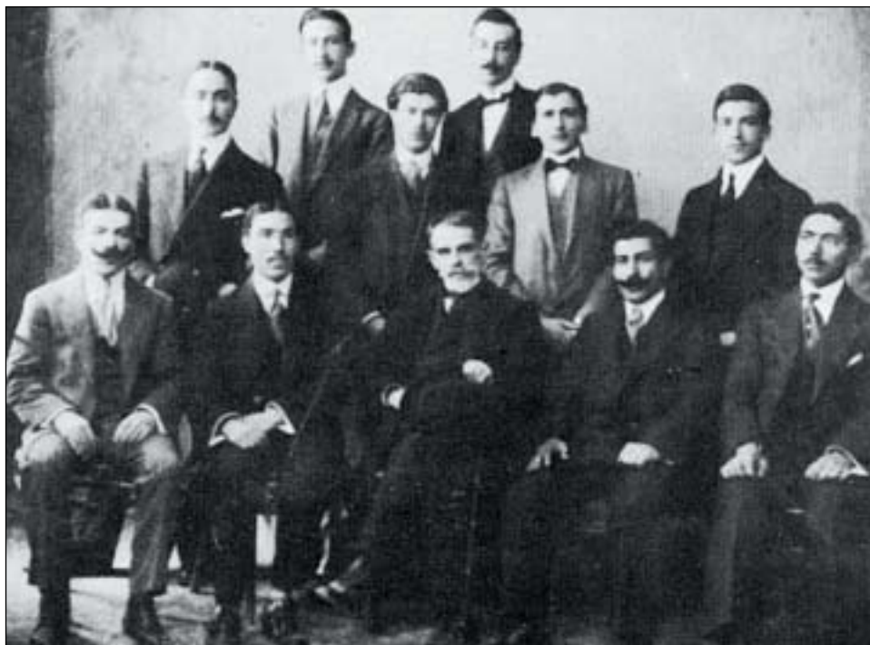
Ο Παλαμιάς με φοιτητές από τη Μυτιλήνη. Ο Μυριβήλης, όρθιος τέταρτος από αριστερά (Ανθολογία Σοκόλη)

Ο Παλαμιάς πέθανε το Φεβρουάριο του 1943 μέσα στην περίοδο της Κατοχής. Ο ιστορικός της λογοτεχνίας μας Λίνος Πολίτης τονίζει ότι ο κόσμος που συγκεντρώθηκε αυθόρμητα για να τιμήσει τον πεθαμένο ποιητή είχε τη συναίσθηση πως προέβαινε σε πράξη εθνικής αντίστασης. Στον τάφο του ο ποιητής Άγγελος Σικελιανός αφηφώντας τους κατακτητές βροντοφώναξε το φλογερό του προσκλητήριο προς την ελευθερία: «Ηχήστε οι σάλπιγγες! Σ' αυτό το φέρετρο ακουμπά η Ελλάδα!».