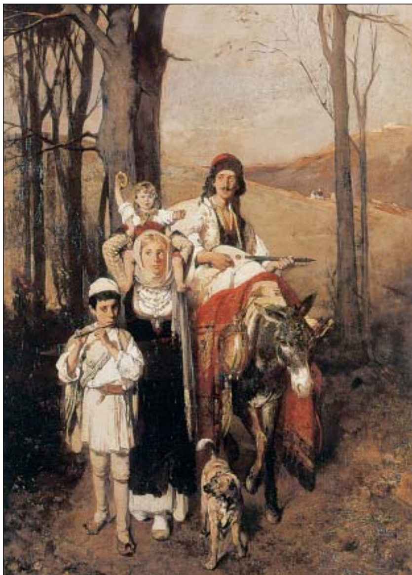
Ν. Λύτρας (1832-1904), «Επιστροφή από το πανηγύρι» (Εθνική Πινακοθήκη)

το περιοδικό προκηρύσσει διαγωνισμό για τη συγγραφή «ελληνικού διηγήματος». Ο Νικόλαος Πολίτης, εισηγητής της λαογραφικής επιστήμης στην Ελλάδα, δίνει το πλαίσιο στο οποίο θα έπρεπε να κινηθούν οι συγγραφείς. Τους καλεί λοιπόν να αξιοποιήσουν τα ελληνικά ήθη και έθιμα και να αντλήσουν τα θέματά τους από τη μακραίωνη ελληνική ιστορία. Οι συγγραφείς ανταποκρίνονται πρόθυμα γράφοντας για την αγνή ζωή των Ελλήνων της υπαίθρου. Ό,τι είχαν πετύχει στο παρελθόν οι συγγραφείς με το ιστορικό μυθιστόρημα, το κατόρθωναν τώρα όσοι καλλιεργούσαν το ηθογραφικό διήγημα.