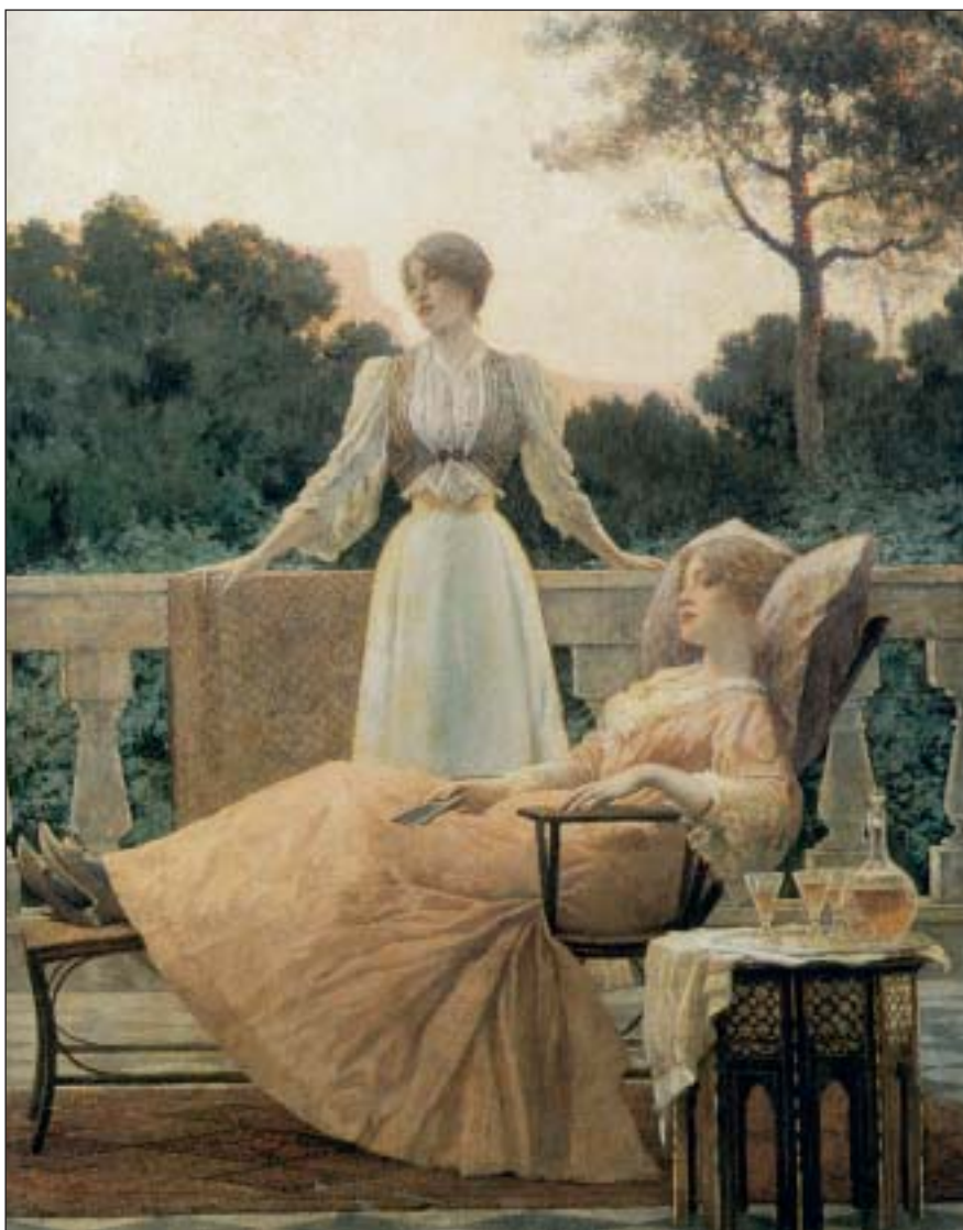
Ιάκωβος Ρίζος (1849-1926), «Στην ταρατσα ή Αθηναϊκή βραδιά» (1897). Στον πίνακα είναι φανερή η επίδραση των ευρωπαϊκών συνθησιών στους Έλληνες αστούς (Εθνική Πινακοθήκη)

τετραπλασιάστηκε. Φανερή ήταν η προσπάθεια της πολιτικής ηγεσίας να δώσει στο ελληνικό κράτος ευρωπαϊκή φυσιογνωμία.