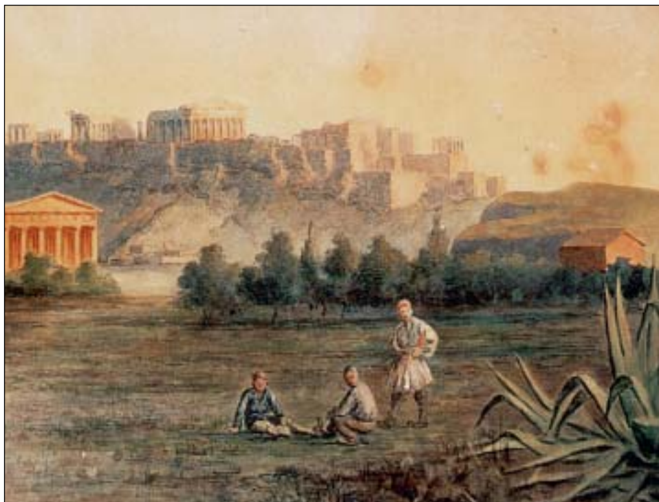
Αιμ. Προσαλέντης (1859-1926), «Η Ακρόπολη», 1897 (Εθνική Πινακοθήκη)

Η Πάπισσα Ιωάννα αποτέλεσε ένα πρωτοποριακό έργο που με το θέμα του σκανδάλισε την κοινωνία της εποχής και προκάλεσε, όπως ήταν φυσικό, την αντίδραση. Η Εκκλησία καταδίκασε το έργο και το συγγραφέα του για το σκάνδαλο που δημιούργησε.