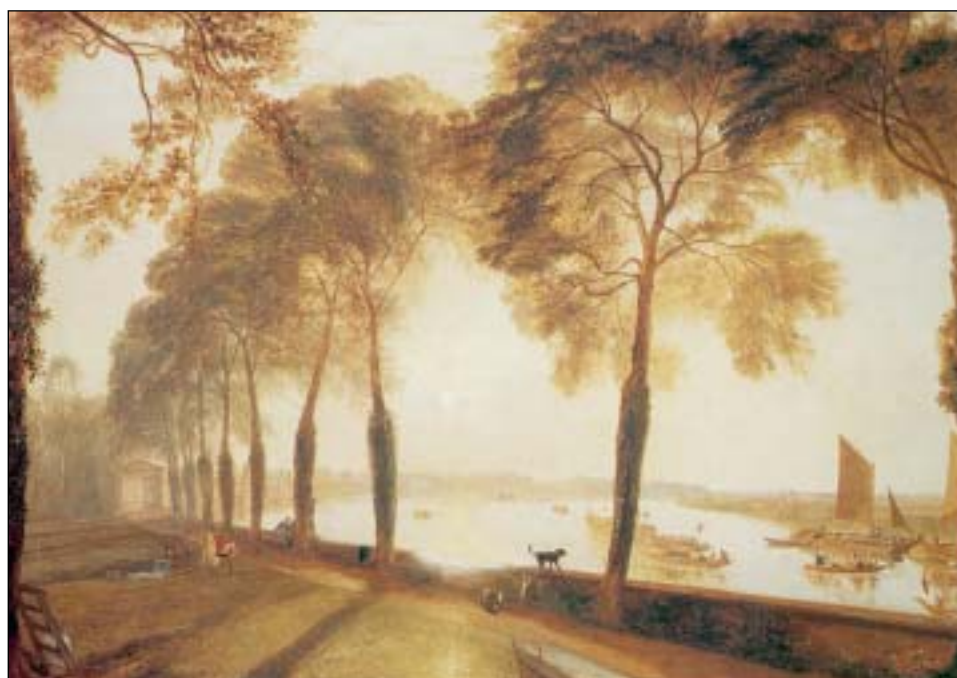
Τζ. Μ. Γ. Τέρνερ, «Το μονοπάτι Μορτλέικ», 1826 (Ο κόσμος της ζωγραφικής, εκδ. Πατάκη)

Στο χρονικό διάστημα ανάμεσα στο 1830 και το 1880, δηλαδή στα πρώτα πενήντα χρόνια μετά την ελληνική Επανάσταση και την ίδρυση του Ελληνικού Κράτους, η Νεοελληνική Λογοτεχνία διαμορφώνεται, όπως είδαμε, κάτω από την ξένη επίδραση και ειδικότερα κάτω από την επίδραση του γαλλικού ρομαντισμού. Χαρακτηριστικά της λογοτεχνίας μας αυτή την περίοδο είναι η επιστροφή στο παρελθόν, η μελαγχολία και η απαισιόδοξη διάθεση που ερχόταν πια ως απόηχος του ρομαντισμού της δύσης. Οι λογοτέχνες προσπαθούσαν την περίοδο αυτή να τονώσουν το εθνικό φρόνημα του λαού.