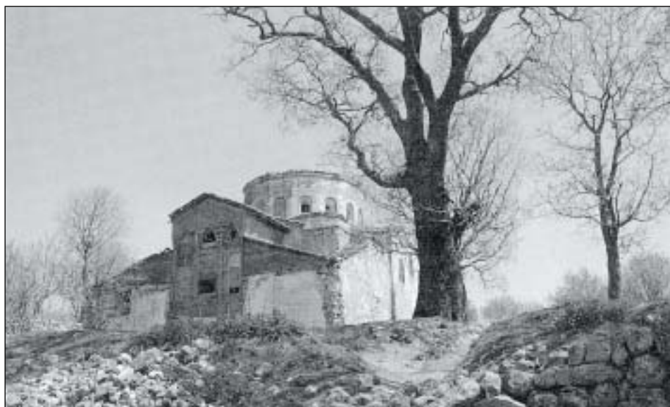
Η Αγία Σοφία Βιζύης, όπως σώζεται στο επάνω κάστρο της άλλοτε οχυρής Πολιτείας των Βυζαντινών (εκδ. Λούση Μπρατζιώτη)

ρίως για την ψυχογράφηση των ηρώων του και αξιοποίησε τα προσωπικά του βιώματα και τις αναμνήσεις του από την πατρίδα του, τη Βιζύη της Ανατολικής Θράκης. Έφυγε από το χωριό του μικρός για την Πόλη και από εκεί για την Κύπρο, την Αθήνα και τη Γερμανία, όπου έκανε σπουδές στη φιλοσοφία και την ψυχολογία. Οι τίτλοι των διηγημάτων του μοιάζουν με αινίγματα ( Το αμάρτημα της μητρός μου, Ποίος ήταν ο φονεύς του αδελφού μου, Αι συνέπειαι της παλαιάς ιστορίας, Το μόνον της ζωής του ταξείδιον ) και συνδυάζουν την αυτοβιογραφία με την ιστορική και την ψυχολογική ανάλυση.