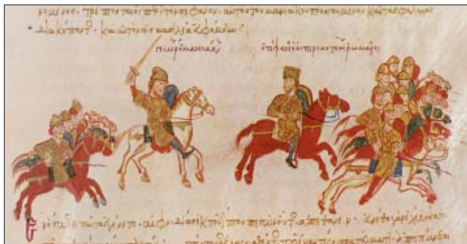
Μικρογραφία από τη χρονογραφία του Ιω. Σκυλίτζη με παράσταση σκηνής από τους αγώνες των Βυζαντινών (Ιστορία του Ελληνικού Έθνους)

εμφανίζονται κυρίως στην Κύπρο και την Κρήτη, όπου υπάρχουν πολλές παραδόσεις για το Διγενή. Στα δημοτικά ακριτικά τραγούδια δεν πρωταγωνιστεί πάντα ο Διγενής αλλά και άλλοι ήρωες ακρίτες, όπως ο Ανδρόνικος, ο Κωνσταντής, ο Αλέξης, ο Δούκας, ο Θεοφύλακτος, ο Πορφύριος. Πολλά επεισόδια από τη ζωή του Διγενή δεν περιλαμβάνονται στο έπος, όπως το πάλεμα του Διγενή με το Χάρο που το βρίσκουμε σε πολλά δημοτικά ακριτικά τραγούδια (ο Νικόλαος Πολίτης έχει συλλέξει 72 παραλλαγές για το θάνατο του Διγενή).