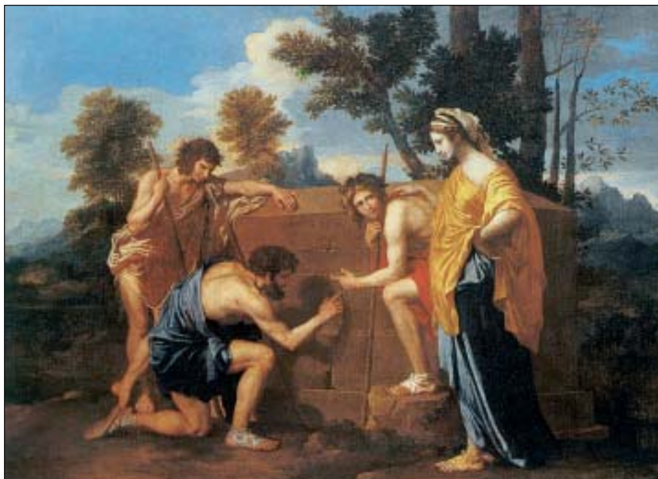
Πίνακας του Νικολά Πουσσέν, «Et in Arcadia ego» (1638-40) (Ο κόσμος της ζωγραφικής, εκδ. Πατάκη)

Η αξία του βιβλίου βρίσκεται στο γεγονός ότι δε δίνει έτοιμες λύσεις στα προβλήματα μιας συγκεκριμένης εποχής, αλλά γίνεται το κλειδί για τη λύση των προβλημάτων κάθε εποχής, που δεν είναι παρά η εφαρμογή των αρχών της δημοκρατίας. Γι' αυτό και το έργο διατηρεί πάντα την επικαιρότητά του.