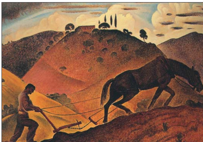
Βάλιας Σεμερτζίδης, Το όργωμα