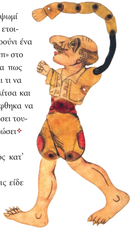
Μάνθος Αθηναίος, Ο Καραγκιόζης

ΧΑΤΖΗΒΑΘΗΣ – Αλήθεια, Καραγκιόζη, και το 'χουν παραμελήσει αυτό το μέρος και έχει και τόσο ωραίο νερό το πηγάδι. Κι εκείνα τα ωραία δένδρα κοντεύουν να ξεραθούν απεριποίητα. Θα κάνατε χρυσές δουλειές, που περνούν τόσοι ξένοι αποκει καθημερινώς. Αυτό δεν είναι χάνι, Καραγκιόζη μου, αυτό μπο-