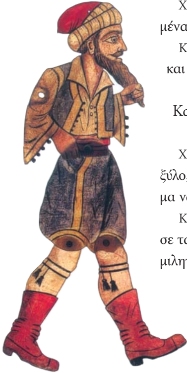
Λευτέρης Κελαρινόπουλος, Ο Χατζηαβάτης

ΧΑΤΖΗΒΑΤΗΣ – Άκουσε, Μπαρμπαγιώργο. Εάν είναι σε αυτήν την κατάσταση