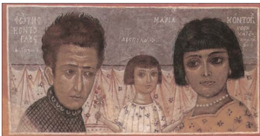
Φώτης Κόντογλου, Η οικογένεια του ζωγράφου